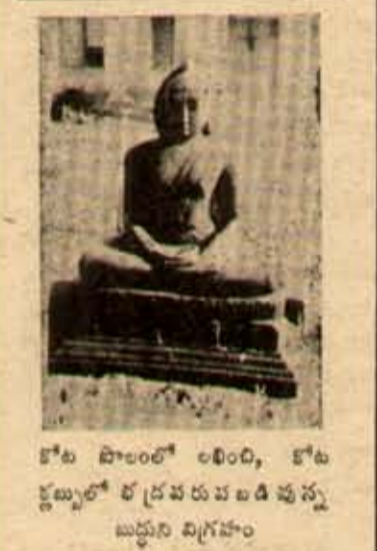
కోట పొలంలో లభించి, కోట క్లబ్బులో కడవరుపబడి వున్న బుద్ధుని విగ్రహం