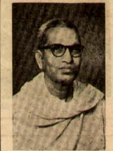
వ్యక్తిపూరితపుకున్న గాంధేయుడు, సర్వోపయోగ వ్యక్తి మన యిటుడు, అదర్చ ప్రజాసేవకుడు, నాస్తిక డి ద్యమకర్త

ఇక ఇప్పుడు పాక్ - చైనాల వాయితులు కలిసి అందాంతరాలలో తమ రమకారాన్ని ప్రదర్శించవలసిన వున్నాను. తమ స్వరకారాన్ని మరది దుర్భాగానికి ఒడిగట్టిన ఈ దుష్టులు ఎవడివారికి నికొడవను చేస్తున్నారు. నింహాళం, ఈ డి ప్పు ఆతి సామ్యంగా ఇండియా - చైనా వివాదపరిష్కారంలోనం అతి సరళమైన ప్రతిపాదనలు చేసినవి; వాటిని కక్షణం ఇండియా ఒప్పుకున్నది; ఎర్రచైనా మినహాయింపులు సూచించి, వరిష్కర్లను తిప్పలు పెట్టినది. బసప్పటికి నిగ్గు - అలా రెండూవదిలి, అదేకాలవద్దే