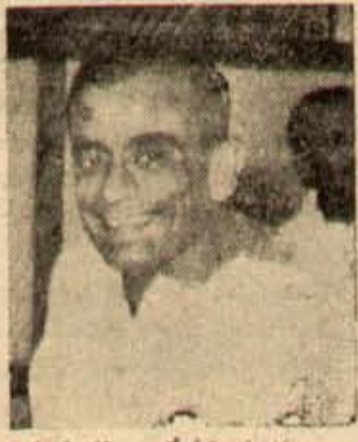
పెద్దలకు కల్పించాలనే వీరి యూహ.

కుక్కలుచింపిన విస్తర దీనికి కారణంగానే జేకపోయింది. శ్రీ సంజీవరెడ్డిగారు ముఖ్యమంత్రి పదవిని వదులుకుంటే, అయినతర్వాత రాష్ట్రమునకు నాయకత్వం వహించడానికి తగిన వ్యక్తి యివ్వరు అనే ప్రవేళమేమిటంటే, రాష్ట్రంలో కాంగ్రెస్ పార్టీ కుక్కలుచింపిన విస్తరగా కన్పిస్తుంది. కాంగ్రెస్లోని అన్నివర్గాలనూ సదువుకపోగలవ్యక్తి ఒక్కరులేరు.