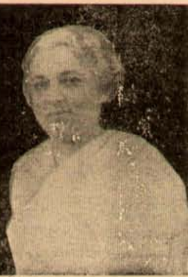
దొంబాయి గవర్నరుగా నియమితు రాలైన శ్రీమతి విజయలక్ష్మిపండిట్

ఈవారంలో మనదేశం చైనాసర్వ లోకసభలో యంతమంబె న్నదూ జరిగివుండలేదంటే అతిశయోక్తి కాదేమో! తమ దండయాత్రద్వారా భారతభాషిణి జాగృతకల్పించిన చైనాకు భారతప్రధాని