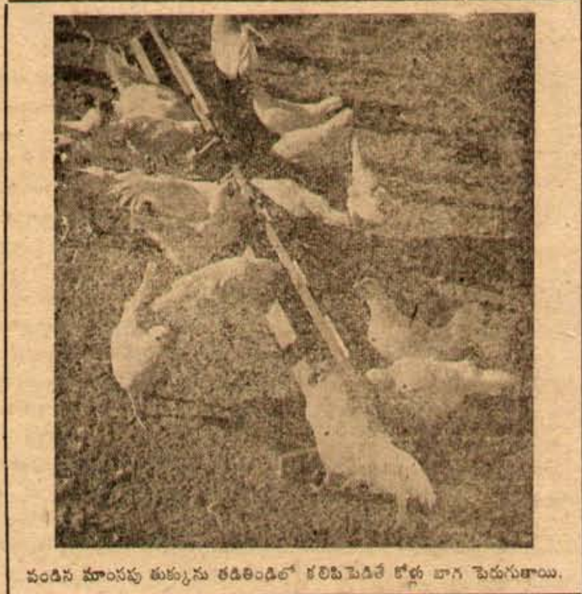
వందన మూసపు తుక్కును తడితడిలో కలిపి పెడితే కోళ్ల బాగ పెరుగుతాయి.

వరిపుడు, కచ్చి మొక్కకోష్టలు మొదలైనవి ధాన్యములను తిండి లభ్యం కాకపోవచ్చు. అలాంటివి తిండి లభ్యం కాకపోతే, వీటికి పశు సంకాశం చేసుకోవాలి. ఇంతకంటే తక్కువరకే తిండి పెట్టరాదు. ముఖ్యంగా పెట్టే తిండి అకచ్చిపుడుగా ఆపి, మరో కోళ్ల రకపు తిండిని పెడితే, ఆ పెట్టడం తక్కువగా గ్రుడ్లు పెడతాయి. అందులో కొన్ని కోళ్లు గ్రుడ్లు పెట్టడం మానితే, శేషికాలం వచ్చేసరికి పాదకాశీ ప్రారంభిస్తాయి. వందకొరంతో ముగిసే కోడాలలోకంటే తిప్పితగా, శేషిక