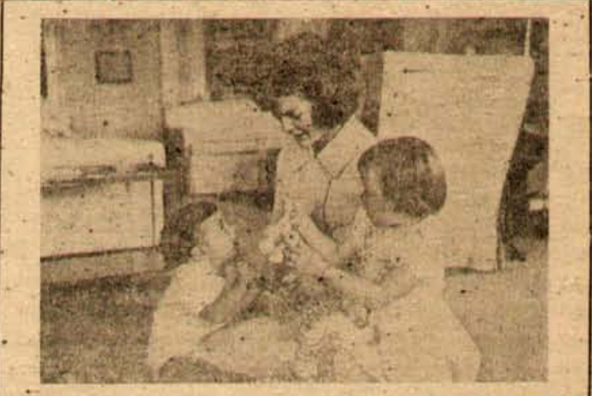
ఆమెరికా అధ్యక్షుడు శ్రీ కెన్నెడీ సతిమణి శ్రీమతి జాక్విలీన్ కు తన పిల్లలతో కాలక్షేపానికంటే సరదాఅయిన విషయం వెల్లడవుతోంది. శ్రీమతి జాక్విలీన్ 12 తేదీ భారతదేశం చేరుతున్నారు.

కాబట్టి ఎక్కువగా క్రాంతి వచ్చింది. ఆరున్నాలు డి.ఎల్.ఎ. యొక్క దళాలు. తమ సాయంతోనే మన ప్రాంతాల్లో చేరారు. ఆరున్నాలు డి.ఎల్.ఎ. యొక్క దళాలు. తమ సాయంతోనే మన ప్రాంతాల్లో చేరారు. ఆరున్నాలు డి.ఎల్.ఎ. యొక్క దళాలు.