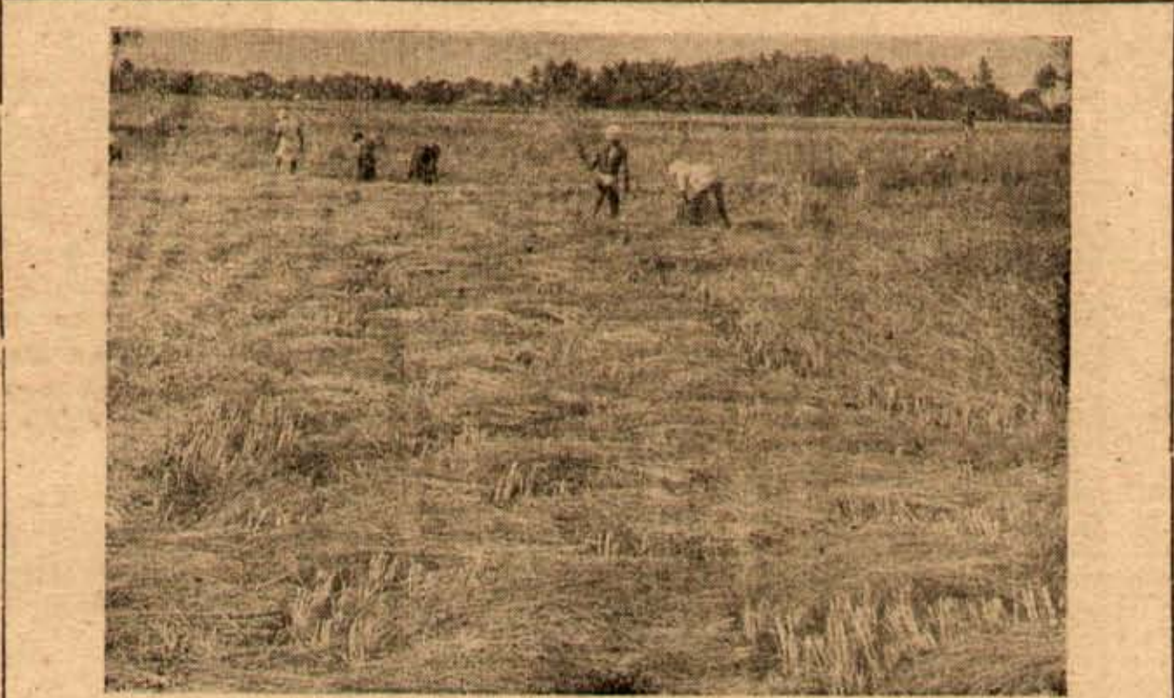
సాంప్రద్యవసాయ పథకంపై ఎకరాలోపంట నాల్గవంతు పెరిగింది. తంజావూరు జిల్లాలో బాగ పండిన పరిశోధన కోతను పై చిత్రంలో చూడవచ్చు.

కృష్ణా, గోదావరి నదుల పుణ్యక్షేత్రాలైన తంజావూరు ప్రాంతంలో ధాన్య పండిండ్లకు ఉన్న ప్రాధాన్యతను తెలియజేస్తున్నాము.