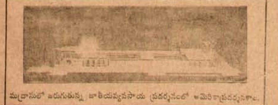
మద్రాసులో జరుగుతున్న కాతియవ్యవసాయ ప్రదర్శనలో ఆమెికా ప్రదర్శనశాల.

కావలి, కోవూరు, నెల్లూరు సభలలో శ్రీ ధేబర్ ప్రత్యేక విజ్ఞాపించారు. శ్రీ గోపాలరెడ్డి భారతమాత సుప్రత్రుడనీ; ఆంధ్రప్రదేశ్ లకు, దేశానికి ఆయన అమూల్య మైన సేవజేశాడనీ; యీ దేశసేవకునికీ, ప్రజలునడాయపడి, ఆయనకు గొప్పవిజయం సాధించి పెట్టగలరని తాను విశ్వసిస్తున్నానని శ్రీ ధేబర్ అన్నారు.