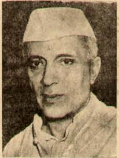
నవభారత నిర్మాత, భారత ప్రజల ఆకాషోతి

కాంగ్రెస్ క్రమశిక్షణ సాధించిన అభివృద్ధిని గూర్చి ఆపార్టీగానీ, ఆ క్రమశిక్షణగానీ చెప్పకోవలసిన అవసరంలేదు. చదువుకున్న