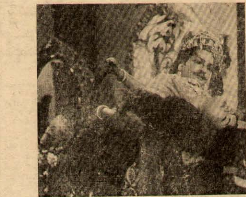
“మహామంత్రి తిమ్మరుసు” చిత్రంలో ఒక సన్నివేశం.

నెల్లూరు జానపదసభ్యులు శ్రీ జి. సి. కొండయ్య జానపదంలో, మామి శిస్తు హెచ్చించుటపై మాట్లాడుతూ, ప్రభుత్వం పొందినవేతున్న ఎక్స్ ప్రెస్ లోను, ఇ నాం గ్రామాలలోను, పాత రైలువూ రేలువే