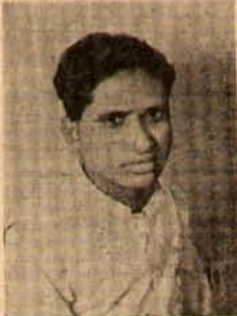
మంత్రి డాక్టరు చెన్నారెడ్డి

బాలిరెడ్డిపాళెం పంచాయతీసమితి అధ్యక్షుని కార్యాలయంలో ఆగస్టు 15, 16, 17 తేదీలందు మేళా మహోత్సవములు జరుగును.