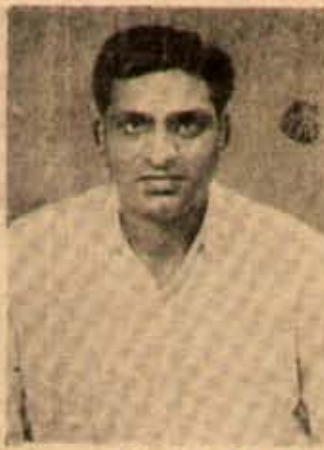
హైస్కూలు నిరంతర ప్రోత్సాహి, కావన సమ్యక్తు