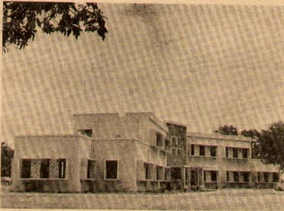
ప్రవేశోత్సవం జరుపుకొననున్న నూతన భవనములు