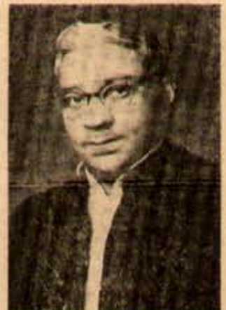
మంత్రి శ్రీ బ్రహ్మానందరెడ్డి