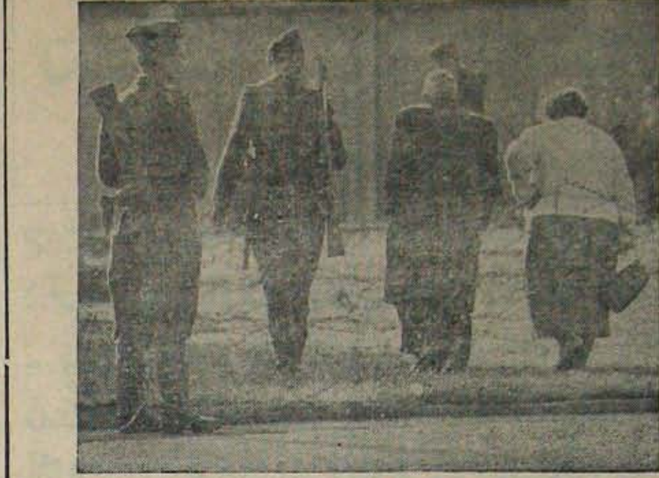
కంటక ప్రాంతమైన కమ్యూనిస్టు జర్మనీనుండి పశ్చిమజర్మనీకి పరుగెత్తడలచి తూర్పు జర్మనీపాలిస్ నిరోధించగా విచారంలో వెనుదిరిగి పోతున్న వృద్ధ దంపతులను చిత్రంలో చూడవచ్చు. పశ్చిమ జర్మనీలో తూర్పు జర్మనీవారు ఆడుగుపెట్టడండా ద్వారాలు బంధించి నిర్బంధాలు పెంచినా ఆ ఒక్కమాసంలోనే 47,433 మంది తప్పించుకొని పోగలిగారు. 1949 నుండి మొన్న ఆగస్టు అంతవరకు పశ్చిమ జర్మనీకి చేరిన తూర్పు జర్మనీ వాసుల సంఖ్య 27,12,547 అట!

స్థాయిలోకూడా 'క రీ ట్' జరగవలెను. లేకుంటే కాళ్ళతం గా 'వెద్దలు' సమాజీవం లోనే సమాజలహం సాగిస్తూ, లోకాన్ని ముంచిస్తారు. ఇప్పటి నాగరిక ప్రకండాని కిదేస్సస్తే.