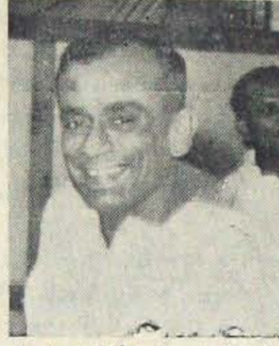
మొలైం నలుగురితో కూడిన ప్రాథమిక కలికల సంఘాన్ని ఆధ్యక్షుడు శ్రీ సంజీవరెడ్డియే నియమించారు. ఈ ఉపసంఘంవారికి, అసీలు దంభాస్తుల కలికలలో తోడ్పడేందుకుగానూ శ్రీ కె. కాంగ్రెస్ కార్యదర్శి శ్రీ వెంకట్రాజు వెంక