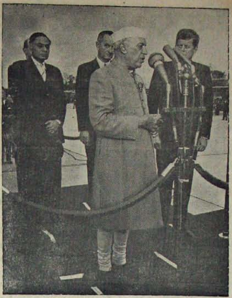
ప్రధాని శ్రీ నెహ్రూకు అమెరికా అధ్యక్షుడు శ్రీ కెన్నెడీ స్వాగతం.

లోకాద్వార కలిగిన అంగీకరించిన ఒక మిలిటరీ - సివిల్ కలిపాలకుని (జనాధీనమైన వైశిష్ట్య దగ్గర మోకార్తర్ వంటివాని) చేతిలో విరాస శత్రు కాంగ్రేసు ఉంచడానికి ఏర్పాటు జరిగితే తప్ప ఆ రాజ్యానికి విమోచనం లోకం వచ్చుచుండు.