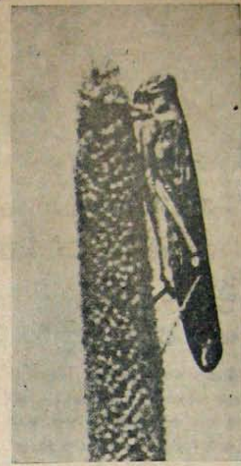
సజ్జ కంకిపై వాలిన మిడుత

పంకరవారి మొక్కజొన్న లాభదాయకము. ఈవారి మొక్కలు దృఢంగా మొలుస్తాయి. వైరం తా సమంగా కంటకొస్తుంది. కంట దిగుబడి వచ్చు. టెక్సాస్ 26, ఎఫ్. సి. 27 రకాలు విత్తడం మంచిది. విత్తుకు విత్తుకు ఒక అడుగు, వరుసకు వరుసకు రెండు అడుగుల ఎడముండాలి. ఎకరాకు 12-15 పాసుల విత్తవంచాలు. విత్తు సమయంలో ఎకరాకు 100 పాసుల మాకర్ ఫాస్ఫేటు, 100 పాసుల అమోనియం ఫాస్ఫేటు వేయాలి. ఈ ఎరువులను విత్తనపు వరుసలకు 3-4 అంగుళముల దూరాన, 2-3 అంగుళముల లోతున వేయాలి. పంకరవారి మొక్కజొన్న విత్తనం క్రితం సంవత్సరపువైతే దానిని ఉపయోగించకూడదు. అది పగుళ్ళు చిచ్చువుంటాయి. కంట దిగుబడి వాగావుండదు. కనక తాళాదిక్తకాలనే వాడాలి.