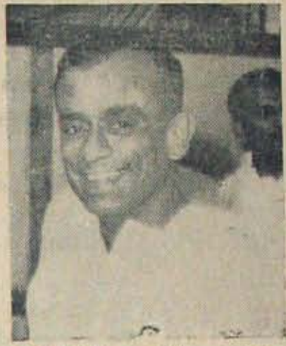
వర్గ వైవమ్యాల సమయంపుకు వీరి పర్యటన దోహదమిస్తుందా?