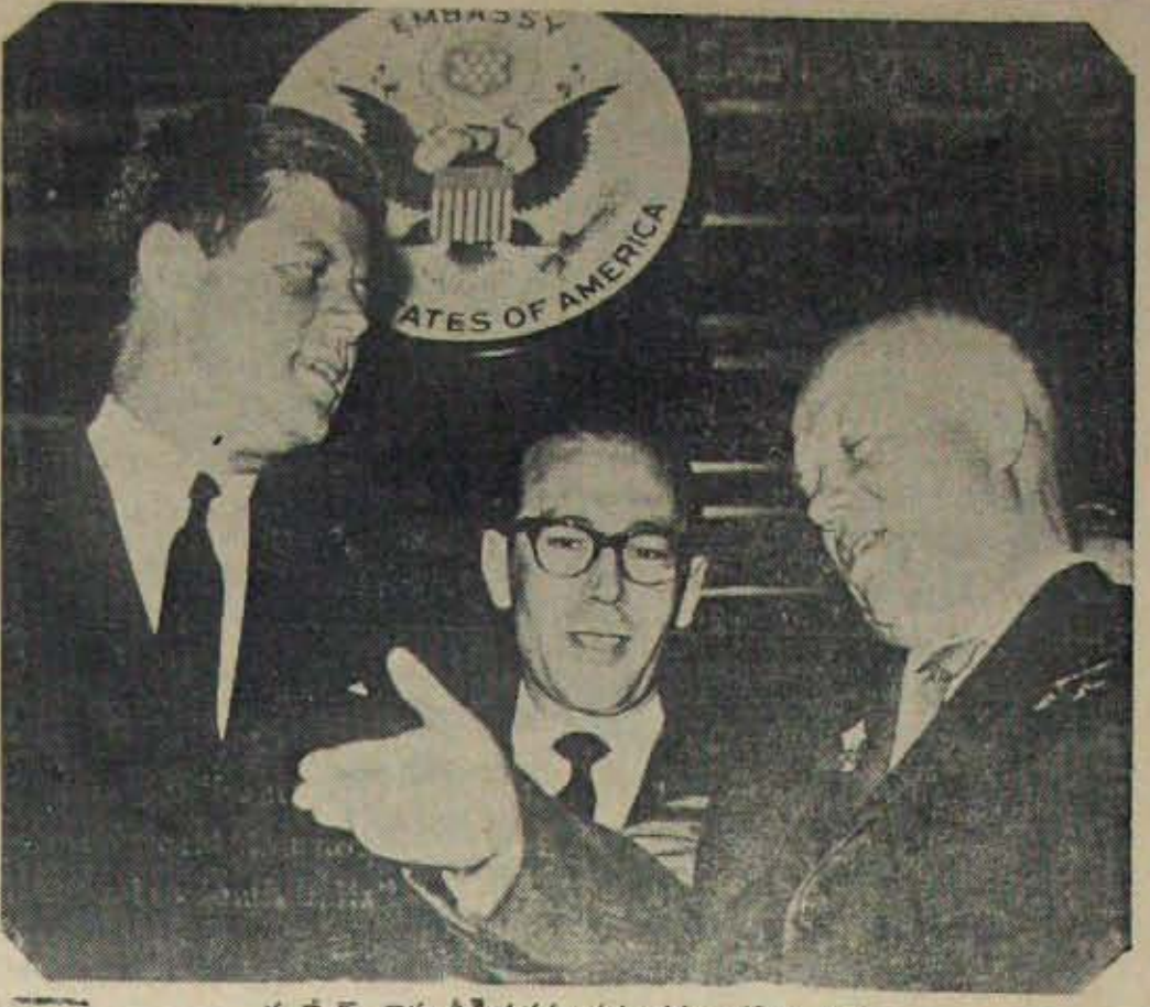
కృషి-కెన్నెడీ ప్రథమ సమాగమం (వియన్నా)

రాణి కుదరవంతున, అమెరికా చాల ధనవ్యయం మిలిటరీ మిన భక్య పెడుతున్నదని, కానీ కుదరవంతున, అమెరికా వారి ధనవ్యయం మిలిటరీ మిన భక్య పెడుతున్నదని,