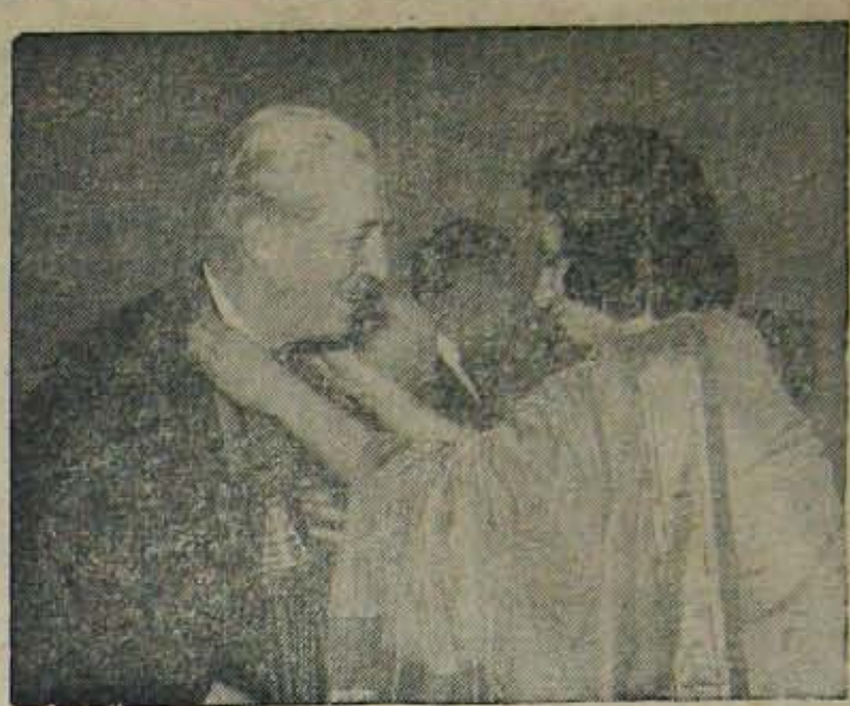
లండన్లోని భారతీయ విద్యార్థుల యూనియన్ కు, హాస్టలుకు బ్రిటిష్ ప్రధాని శ్రీ మాక్మిలకా వచ్చినప్పుడు, వారిని మూలం కృతులను జేస్తున్న ఒక భారత విద్యార్థిని. ఈ సందర్భంలో విద్యార్థుల నుద్దేశించి "మూడవ ప్రపాళికకు మీరే పునాదులు" అన్నారు మాక్మిలకా.

బాలాకపల్ల, కొ.పమద్యం చెరువులకు మడగుప్రాజెక్టు నీరు మరలించుట; కొట వాడు, మాధరం, కరుగుంటపల్లెలకు; వెంకటాచలపల్ల, పాన్పు వోలు, జ్యోతిపంత్వాడి పల్లెలకు; లింగంకల్లి, ఒక్కోలు, మాచపల్లెలకు; ఇప్పకల్లి, రావులకొల్లు గ్రామాలకు- వెన్నావదినుండి కంపింగుస్కీములు; ఎప్పి రాళ్ల, లుక్కాయపల్లె గ్రామాలకు వెన్న నుండి దొంగసానికాల్యశ్రవ్యం; క్రామ్మల పల్లె చెరువుకు జోవిళ్ళపరివంక నీరును మరల్చుటకు వరకాల్య; చంద్రకల్లి, ఆడుగువారి పల్లె చెరువుల అభివృద్ధిస్కీములను అమలు