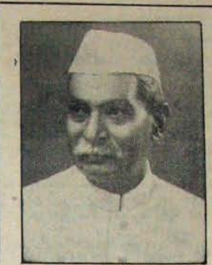
నిజమైన గాంధీవాది, దేశభక్తుడు, త్యాగి, వినియోగచరితుడు, రాజర్షి రాష్ట్ర పతి డాక్టరు రాజేంద్రప్రసాద్ కు 31వేది 77వండ్లు నిండి 78వ ఏడు ప్రవేశించి నది. భారత ప్రజల ప్రేమ పాత్రుడు, గౌరవ భాజనుడైన శ్రీ రాజేంద్రబాబుకు 'జమీన్దార్లు' భారాంక్షలందజేస్తున్నది. శతాయుష్షాభిషేకం!

అసలు స్వతంత్ర పార్టీనాయకులు చెప్పే మాటలకు, పరిస్థితులకు పొంతంలేదు. మిత వాదపార్టీగా వీడదేకమైన భారతదేశంలో స్వతంత్రపార్టీకి విజయవకాశాలు చాల పరిమితం. మర దృక్పథం. ఆ పార్టీకి శనిమాట వాస్తవమే కాని, వారు కులమతపార్టీలైన దృవిడమున్నేత్రకజగం, జనసంఘం, ఆకాశి దళంతో ఎన్నికల పొత్తుకు తాకతయకడడం లాస్తే స్వతంత్రపార్టీ ఆశయాలుక, ఆచరణకు ఎక్కడ సామ్యంకనపించదు. స్వతంత్ర పార్టీ ఆశయాలు గాంధీ జీ ఆశయాశేని స్వతంత్ర పార్టీ నాయకులు శెప్పడం ఆశ్చర్యంగావుంది. గాంధీ జీ దరిద్రవారా యలుల క్రమింధి. కాగా స్వతంత్రపార్టీ, సంస్థాపాధీకృతల భూస్వామ్య జమిందారీ అభివృద్ధి నిరోధకవర్గాల క్రమింధిగా వ్యవ —కొరవ 11-వ పేజీలో