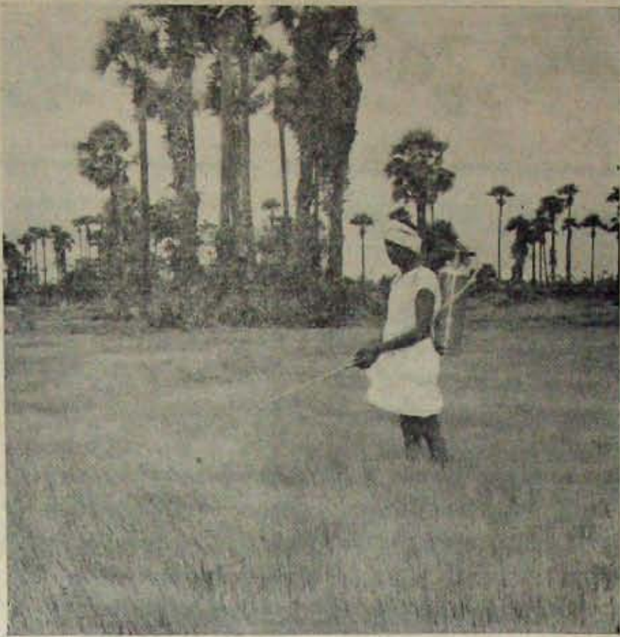
తెగులు తగిలిన పరి పైరుకు మందు స్ప్రే చేయబడుతున్న పశ్చిమ గోదావరిజిల్లాలోని ఒక వ్యవసాయక్షేత్రం

పకాలంలో రైతులకు పంపరాచేయుట జరుగు తోంది. అలాగే రైతులు పీటిని కానుక్కొ టునికగాను బా క్యం లేకుండా ఆత్మలు నుంజూరుచేయుట, రైతులుకండించిన ధా క్యా దులు నిలువచేయడానికవసరమైన గిడ్డంగులు, పరిమైన ధరలు రాబట్టడానికగాను తగు మార్కెటింగు సౌకర్యాలు ఏర్పాటుచేయుట కూడా యీ కర్తలలో వుద్దేశించబడింది. అంతేగాక రైతులకు కావలసిన సాంకేతిక సహాయం ఆలవ్యంలేకుండా అందజేయుటకు గాను, ఈ కర్తలకొకద క్రశ్యేక సిబ్బంది ఏర్పాటుచేశారు. ఈ కర్తలకొకకారం క్రతి రైతు కమతానికి, ఆధికోత్పత్తి క్రణాళిక నొకదాన్ని తయారుచేసి అయిదేండ్లలో ఆ -కొరవ 10-వ పేజీలో