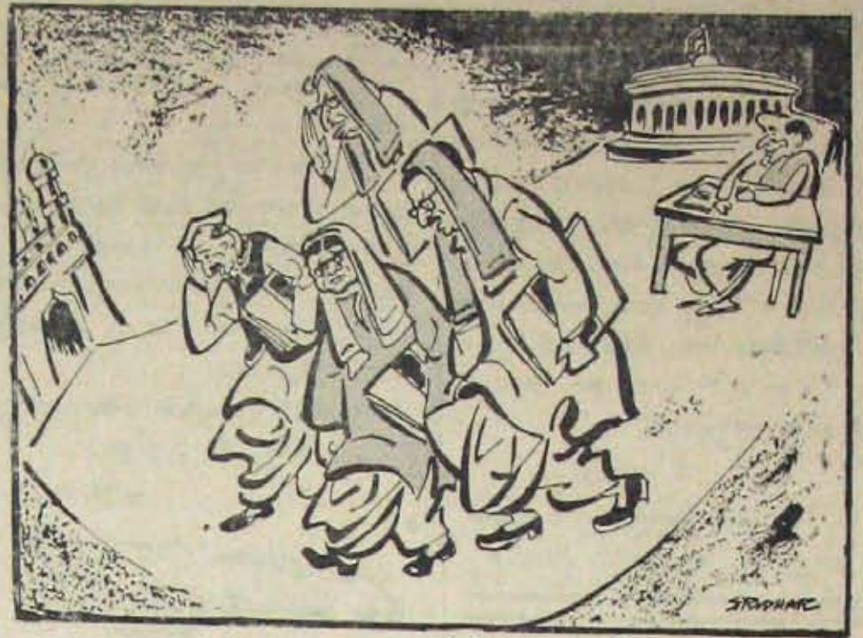
ఆంధ్ర కాంగ్రెస్ నాయకులు ఆశాభంగంతో హైదరాబాద్ కు తిరిగివచ్చారు.

సంపుటి 33 * సంపాదకుడు : నెల్లూరు శ్రీరామమూర్తి * సంచిక 49