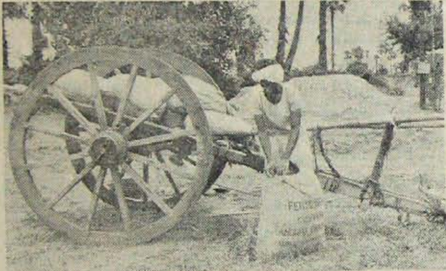
రసాయనిక ఎరువుల బస్తాలను పొలంవద్ద డించుకుంటున్న పశ్చిమ గోదావరిజిల్లా రైతు

డి మైసూర్ ఇన్సెక్టి సైడ్స్ కంపెనీ, 31-వ, నార్త్ బీచ్ రోడ్ - మద్రాసు-1.