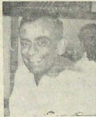
ఆంధ్ర రాజకీయాలలో పునః ప్రవేశం?

వుండాలో ముందుగానే అధిష్టాన వర్గం వారు తేల్చుకుని, కావలసిన కొత్త వాడుకడికి ఆను కూలంగా, ఆ భ్యర్తుల నిర్ణయం జరగాలని గూడా వారు కోరారు. అందువల్లనే తనతో కలిసివున్నట్లు నమ్మించి, మోసగించినట్లుగా, అల్లూరిపై శ్రీ సంచీవ రెడ్డిగారు మాపులు చూడటం గూడా జరిగిందని తెలిసింది. మళ్ళీ రాష్ట్ర రంగంలో అల్లూరి - సంచీ వయ్యలు ఏకమై, యీ కొత్త పరిస్థితిని తెచ్చి పెట్టినందున శ్రీ సంచీవ రెడ్డి గారు మరో కొత్త యెప్పుకోవాలి.