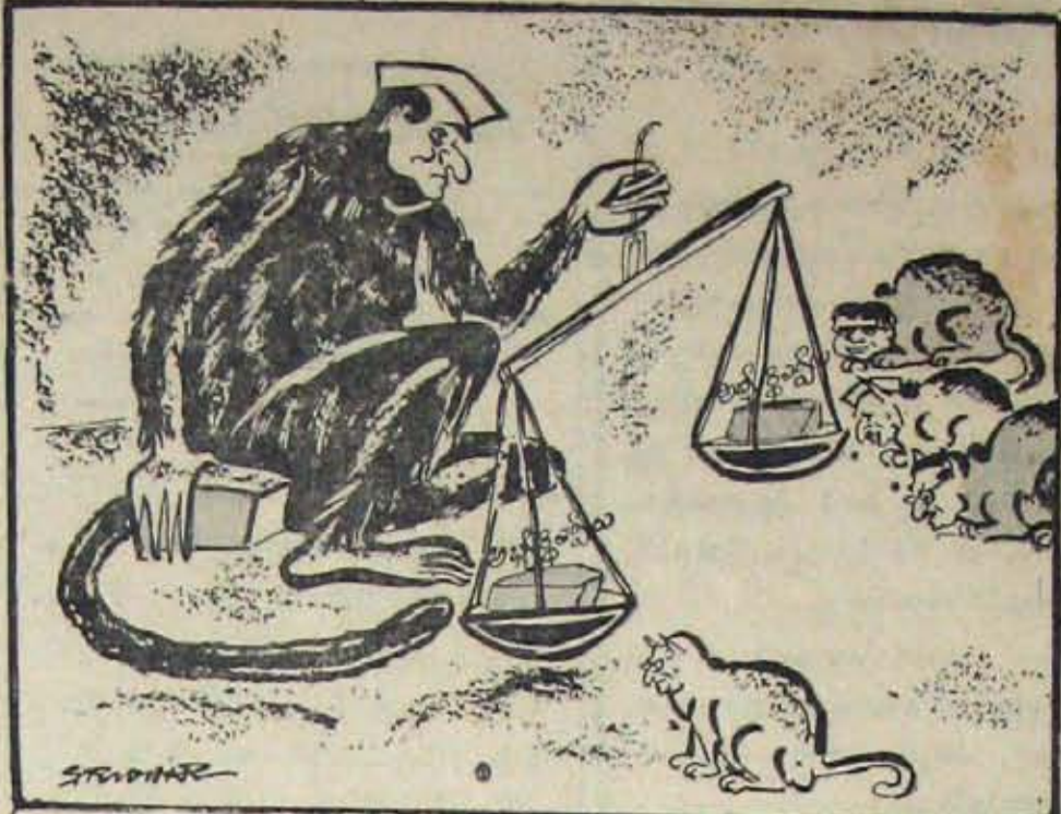
ఫిలిలో ఆంధ్ర కాంగ్రెస్ అభ్యర్థుల నిర్ణయం యింకా పూర్తి కాలేదు.