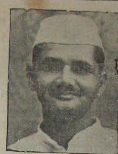
నిర్వహిస్తున్న ఆగ్ర నాయకులు శ్రీ లాల్ బహదూర్ శాస్త్రి