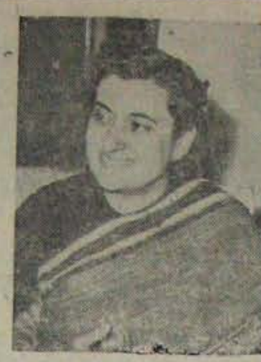
కాంగ్రెస్ అధ్యక్షుల నిర్ణయ క్షిప్త బాధ్యతను శ్రీమతి ఇందిరాగాంధీ