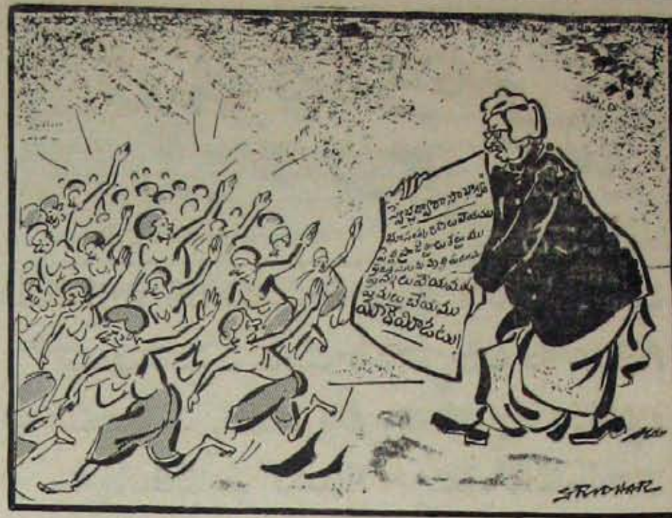
స్వతంత్రపార్టీవారి "స్వేచ్ఛద్వారా సాభాగ్యానికి" సామాన్య ప్రజలలో కావనమును సుముఖత!

తమ ఆకాయ సిద్ధాంతాలలో ఏకీకరణించి యితర పార్టీలలో పోత్తు పెట్టుకుంటామని గూడ