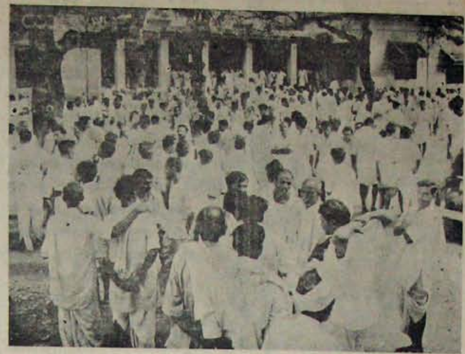
27 తేదీ మినగల్లుకేసు తిరుగుబాటు నెల్లూరు జిల్లా సెషన్స్ కోర్టు ముందు నిరీక్షిస్తున్న వేలాది ప్రజలు

తీర్పు ఫలితం తెలిసిన వెంటనే ముద్దాయిల కేసుగా రిజిస్టర్ పేటికలో దాఖలు జేయబడి మూడువారాలపాటు, హైకోర్టులో