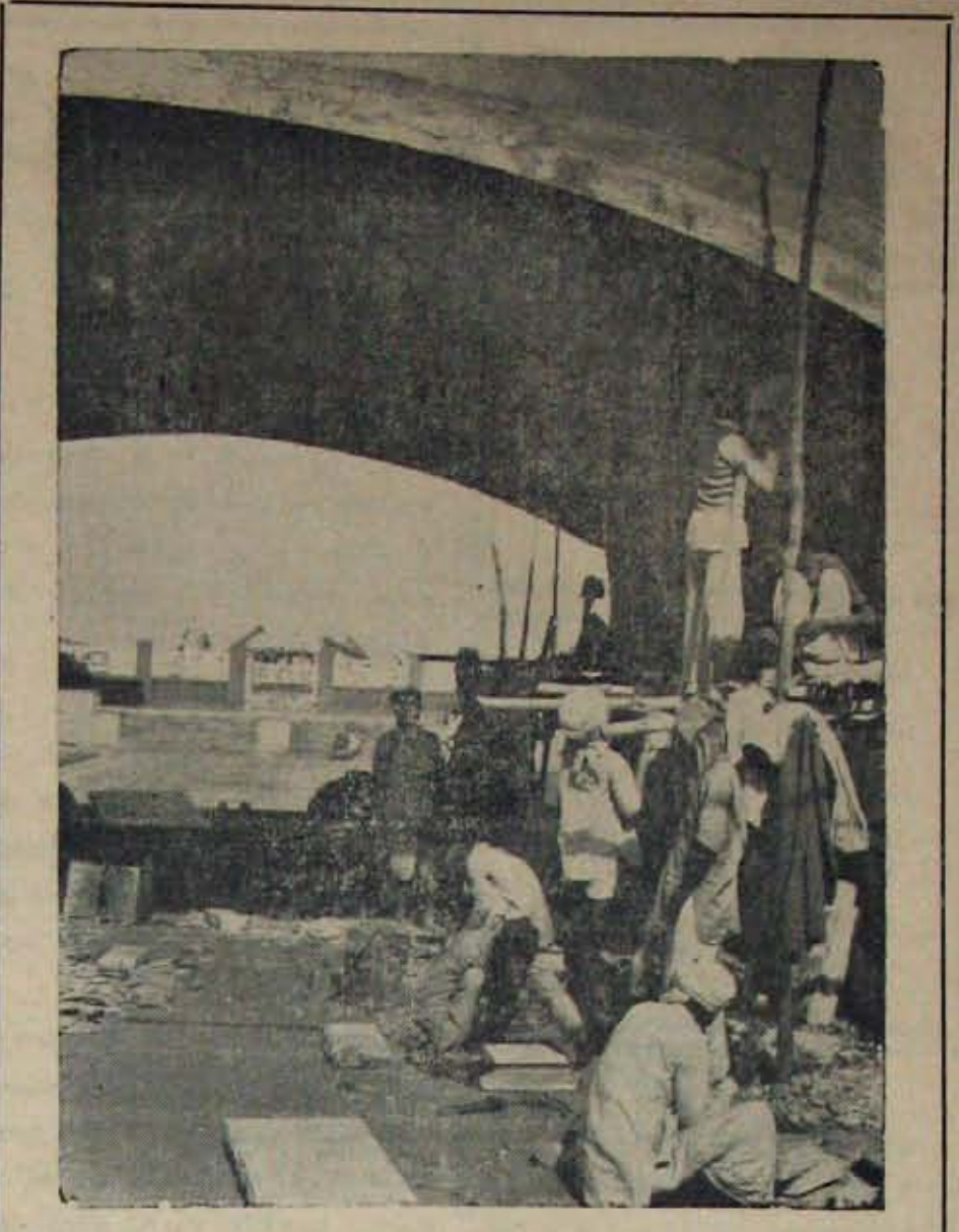
ధిల్లరాజుపూట్లోని గాంధీజీ సమాధినిర్మాణం ప్రారంభమై, ప్రధమ దశ వచ్చేసరివత్సరం పూర్తికానున్నది. మెరుగుచెట్టిన నల్లరాతిలో సమాధినిర్మాణం జరుగుతుంది. సమాధికిపోయే మార్గంలో నిర్మించబడుతున్న నాలుగు అర్చిలలో ఒకదానివద్ద పనిజరుగుతుండడం చిత్రంలో చూడవచ్చు. చిత్రంలో వెనుకకనుపించేదే బాపూజీసమాధి.

ఇరుకడాల కృతానం చాల తీవ్రంగా వున్నది. ధనం మం తి సీ క్కు గా వ్యయమవుతున్నది. కాట్ల, మనుషులు నిర్మిరామంగా తిరుగుతున్నారు. కజకర్ల గోకర్ల విద్యులు క్రవర్షింపబడుతున్నవి. కొందరు కుండాయతీ అధ్యక్షులు ఎక్కడో సంశోధనాలకు పుంకణిచారు తీ పరస్పర ఆలోచనలు వినిపిస్తున్నవి. ఓటర్లకు సంబంధించి స్థానిక స్వతంత్రపార్టీ వాయ జలమాపు వా గా క్షణం సాగరం, ప్రాదరా