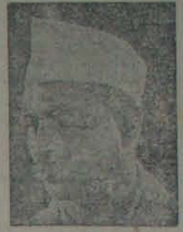
—కొరవ 7 కు పేజీలో

ప్రచోదకాంగ్రెస్ ఆద్యక్షతకు పుణ్యపర్వాలకు ఆమోదయోగ్యుడైనప్పటికీ పల్లంరాజుగారు ఎన్నుకోబడడంలో గూడా కొన్ని చిక్కులున్నవి. వారు ఆద్యక్షతకు సమ్మతించడం జరిగితే, ఏకగ్రీవంగానే ఆద్యక్ష ఎన్నిక జరగవలసివుంటుంది; అందు కార్యవర్గ నిర్మాణ బాధ్యత మామూలువలే ఆద్యక్షుని కి వదలకుండా, ఎన్నికద్వారానే జడగాలని కోరబడవచ్చు; అప్పుడు సమ్మతపరనే విషయంలో రాజీకుదరవలసి వుంటుంది; తేనీపక్షంలో ఎన్నికజరిగి కడకు బలాబలాల ప్రచర్యనకు దారితీయవచ్చు. ఇంచేగాక పల్లంరాజుగారిస్థానంలో