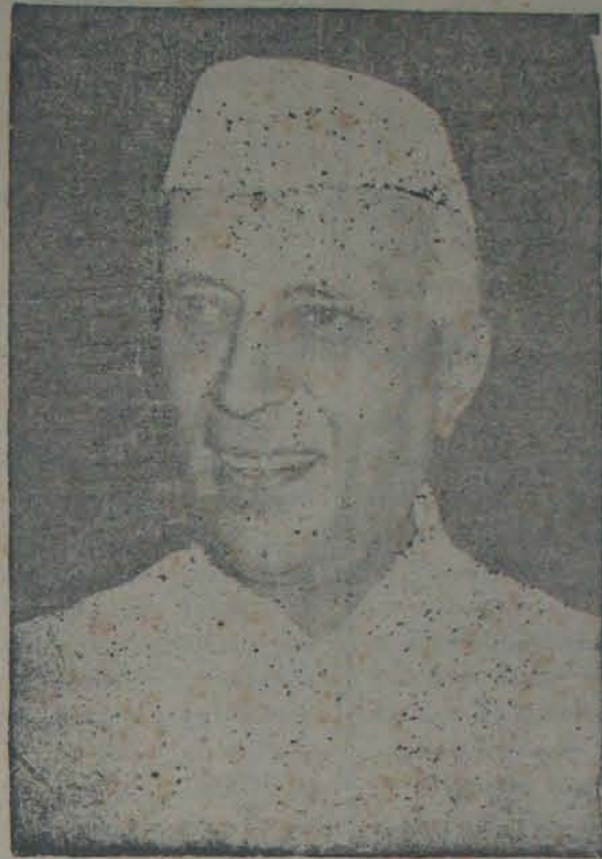
ప్రధాని శ్రీ జవహర్లాల్ నెహ్రూకు జేజేలు! 14 తేది శ్రీ నెహ్రూ 72 వ జన్మదినోత్సవం

సంపుటి 32 * సంపాదకుడు : నెల్లూరు శ్రీరామమూర్తి * సంచిక 45