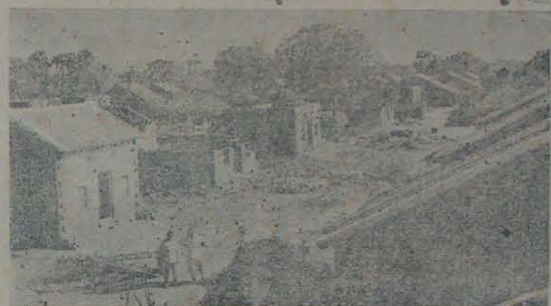
వృత్తిమ నోకావరిజిల్లా చింతలపూడి పంచాయతీ సమితిలో నిర్మాణంలోవున్న ఒక బూరికన కాలనీ

ప్రజలందరూ కలిసికట్టుగా పనిచేసి కనలు తెరవేస్తున్న వు చా చా రణలు చాలా వున్నాయి. ఇందులో ముఖ్యవిషయమేమంటే సమస్యప్రయోజనంకలిగి కథకాలను ప్రారంభించి పూర్తిచేసుకోవడంలో సామాజికవైకన్యంతో ప్రజలు వుత్సాహం కలిగివచ్చి కలిపివస్తుల సాధించుకున్నారు. కడదిన ఏడాది పొడుగునా యిటువంటి సత్కృషి చాలా ఎక్కువగా జరిగింది. ప్రజలు తమ ప్రతినిధుల నాయకత్వం పనిచేసి బ్రహ్మాండమైన ఫలితాలు సాధించుకున్నారు. అయితే అన్ని వ్యాపకాలలో అన్ని విషయాలు సవ్యంగానే వున్నాయని అర్థంకాదు. అదర్భం అందుకోవడం అంత నులువైన విషయమని భ్రమకడడంకూడా తప్పే. కొంత తక్కువ స్థాయిలో కృషిచేసినవారు తమంటేబాగా పనిచేసినవారిని అదర్భంగా తీసికొని యితోధికంగా కృషిచేయాలి. స్వల్పవ్యవధిమాత్రమే అయినా, కడదిన ఏడాదికాలంలో కలిగిన అనభవకలమై, ప్రజలందరూ ఆభ్యుదయ కృషిలో పాటాపాటిలుకడి యింకా ఎక్కువగా ఫలితాలు సాధించటానికి ప్రయత్నం చేయవలసివుంది. కేడు మనరాష్ట్రంలో మాత్రమే గ్రామాలలోనైతే జరుగుతున్నదేమిటి? ప్రతి గ్రామంలోనూ కిక్కిరింపజేసి ప్రారంభించి పనిచేయటానికి ప్రజలు యీనాడు పూనుకున్నారు. సామాజిక శ్రేయస్సును కాంటీంచి, సమస్యప్రయోజనాల సాధనవై వారు కంటకంకట్టి పనిచేస్తున్నారు. ఈ సమస్య ప్రయోజనకృషి ని వాదం సమస్తప్రజల హృదయతంత్రీప్రసవమై యీనాడు మారు ప్రాగు కలుపు ది. అన్నిరంగులకు చెందిన ప్రజలు, యువకులు, వృద్ధులుకూడా యీ