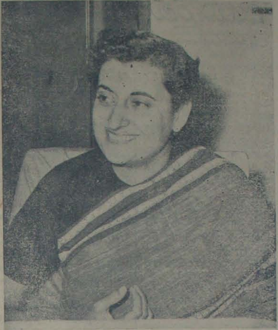
విమిషున్న కాంగ్రెస్ అధ్యక్షురాలు శ్రీమతి ఇందిరాగాంధీ

శ్రీమతి ఇందిరాగాంధీ కాంగ్రెస్ అధ్యక్షత యిటీవలి కాంగ్రెస్ చరిత్రలో ఘట్టమైంది.