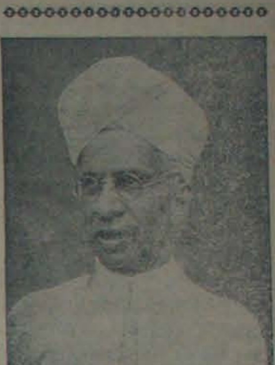
గత కనివారంతో 71 సంవత్సరాలు నిండిన వేదాంతం, భారత ఉపరాష్ట్రపతి శ్రీ రాధాకృష్ణ పండితుడు

దలైలామా దోత్యం యిండియాలో ప్రవాసం వుంటున్న టిబెట్ సీతాపతి రాజ్యాధికారి అయిన డలైలామా, టిబెట్ సమస్యను విశ్వరాజ్యసమితికి తీసుకొని వెళ్లెందుకు, ఢిల్లీలో రెండు వారాలుగా మకాంపేసి, తీవ్రప్రయత్నం చేస్తుండడం గమనించదగిన విషయం. తన ఆశయ సాధనకు సహాయకడవలసిందిగా ప్రపంచంలోని వర్ణదేశాలన్నిటికీ డలైలామా విజ్ఞప్తి చేశారు. ఈ సందర్భంలో ఢిల్లీలో మన ప్రధానిని, రాష్ట్రీకమిని, హోం రిక్షణశాఖల మంత్రులను కలిసి సంప్రదించారు. కాని డలైలామాకు, టిబెట్టు సమస్యను వి. రా. సమితికి గొంపోవుటకు యిండియా ప్రభుత్వం సహాయకడదని ప్రధాని శ్రీ నెహ్రూ స్పష్టం చేశారు. వి. రా. సమితికి యీ సమస్యను తీసుకొని వెళ్ళుటాదవని తన వ్యక్తిగతాభిప్రాయమనికూడ, శ్రీ నెహ్రూ వెల్లడించారు. అంతే కాదు డలైలామా ప్రభుత్వాన్ని ప్రధాన ప్రభుత్వంగా కూడ యిండియా అంగీకరించదని శ్రీ నెహ్రూ స్పష్టం చేశారు. దీనివల్ల, టిబెట్