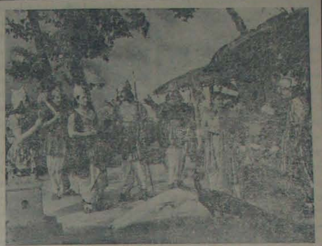
ధనలక్ష్మి ప్రాధక్కున్నవారి 'మహారథి కర్త' తెలుగు చిత్రంలో - విదురుని ఆశ్రమంలో పాండవుల సమాలోచనాదృశ్యం యిది. ఈ చిత్రం త్వరలో గోపికృష్ణ ఫిలిమ్స్ ద్వారా విడుదల కానున్నది.

పచ్చివా వెరవని ధైర్యకాలిగా, స్వతంత్రంగా, ఆత్మాభిమానంకోసం ప్రాంతాధికారిలైన సంకొందించు వ్యక్తిగా, వ్యాయాసాల వలో ఏమాత్రము వెనుదీయని మహావీరుడు