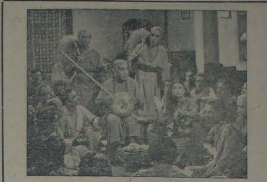
విజయవాడ 'అప్రజేసి పప్పుకూడు'లో శిష్యులసమూహపులలో దొంగ బైరాగి రేలంగి