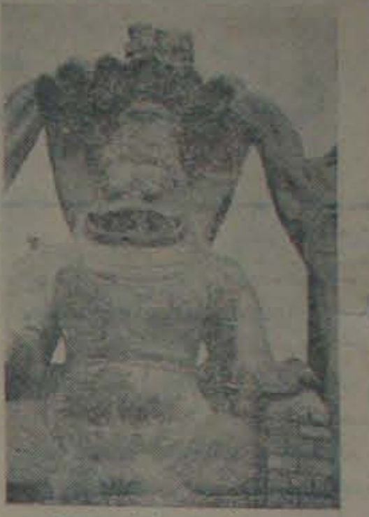
ఈ గ్రనరసింహస్వామి (1 వ విక్రమ)

పద్మగృహము దారు నిర్మాణమేలే ఇమృత కున్నములతో