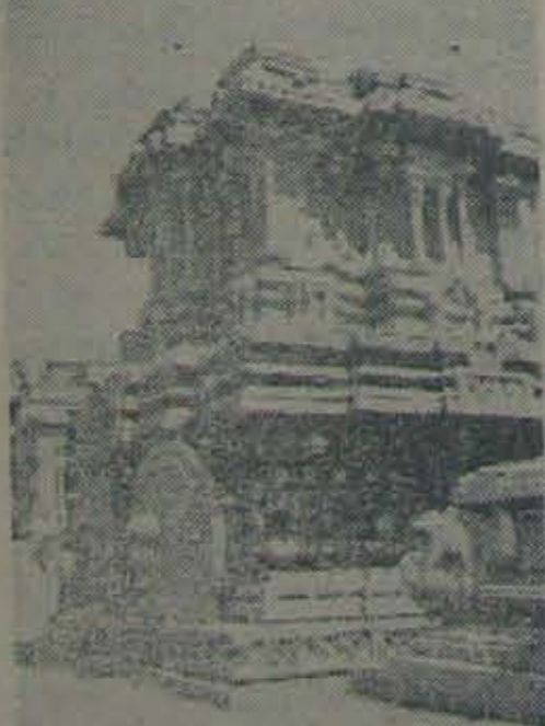
విట్టలాయుమందలి వికళిలారథము (2వ చిత్రము)

శ్రీకృష్ణదేవరాయలు గజకుల నోడించి తిరిగివచ్చునప్పుడు వెల్లుగు మండలములోని ఉదయగిరియందు విడిచినాడు. ఆ చుట్టూ శ్రీకృష్ణవిగ్రహమును స్థాపించియున్న చిన్ని దేవాలయము. ఆ విగ్రహమును హంపికి చేర్చి ఒక పెద్ద ప్రస్తనాలయమును నిర్మించెను. ఆ దేవాలయ విశ్రాంతియుల కారణము. ఆ విగ్రహమును చెన్నపురి వస్తుప్రదర్శనశాల యందున్నది. ఈ దేవాలయ ప్రాంతముననే ఒక పెద్ద రాతిని కట్టించి ఉగ్రనాసింహస్వామి వింబమును పెట్టిరి. దానిని కురుప్పులు విరూపమునివారి. (చిత్రము I.) ఇద్దరికీ ఆన గింజ, పెరిగింజ పుమాలు తారిత్రమును నూదించు గణపతి విగ్రహములు పెద్దవి యున్నవి. శిల్పనాచరుల ఆహాస కాలం యుండెను.