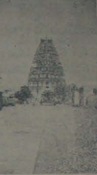
విరూపాక్ష గోపురము (5వ చిత్రము)

ఈ రాతిపై గర్భగుడి గోపురమును, చుట్టును గర్భగుడిముఖము, ముందు ప్రాంతములను కట్టిన రాజులు కట్టించుచున్నారు. ఈ విగ్రహమునకును వెంకటేశుని ప్రతీకము నకును సుమారు 60 అడుగులపైగా దూరముం డును. ప్రాంతపు శిల్పముల తెలుగుగనే