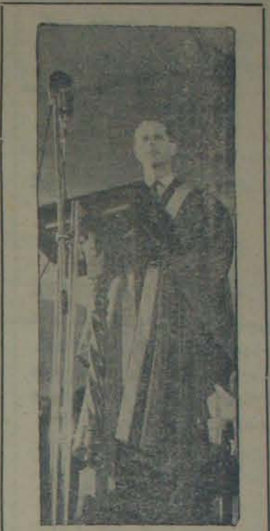
ఇటీవల భారతదేశంలో పర్యటించి పోయిన ఏడిరిబర్ డ్యూకు (ఎరిజెల్ రాజీ భర్త) సైన్యమహాసభలో వుపస్థానిస్తున్నారు

దీని భర్యవసానం చూదాం. ఇందిరమ్మ ముండ్లకంపవీధి కూర్చున్నది. ఆ కంపవీధి తాను కూర్చున్నచోట ముండ్లను ఆదాచితేనే మెత్తవును మాటనిలం. అంతే గాక ముండ్లమధ్యన తోబాపుస్తున్నామని. కాని మిగిలిన ముండ్లన్నీ కనిపిస్తూనేవున్నవి. ఈమె వాటిని నెమ్మదిగా తొలగించవలచు కున్నది. నొంగపర్వత్యాలను రద్దుచేయిస్తుంది. మాటలుగాక పనులుచేసేవారిని ఏరీ వారికి కొన్ని ఖండికేమైన పనులను అప్పకెప్పకలదు.