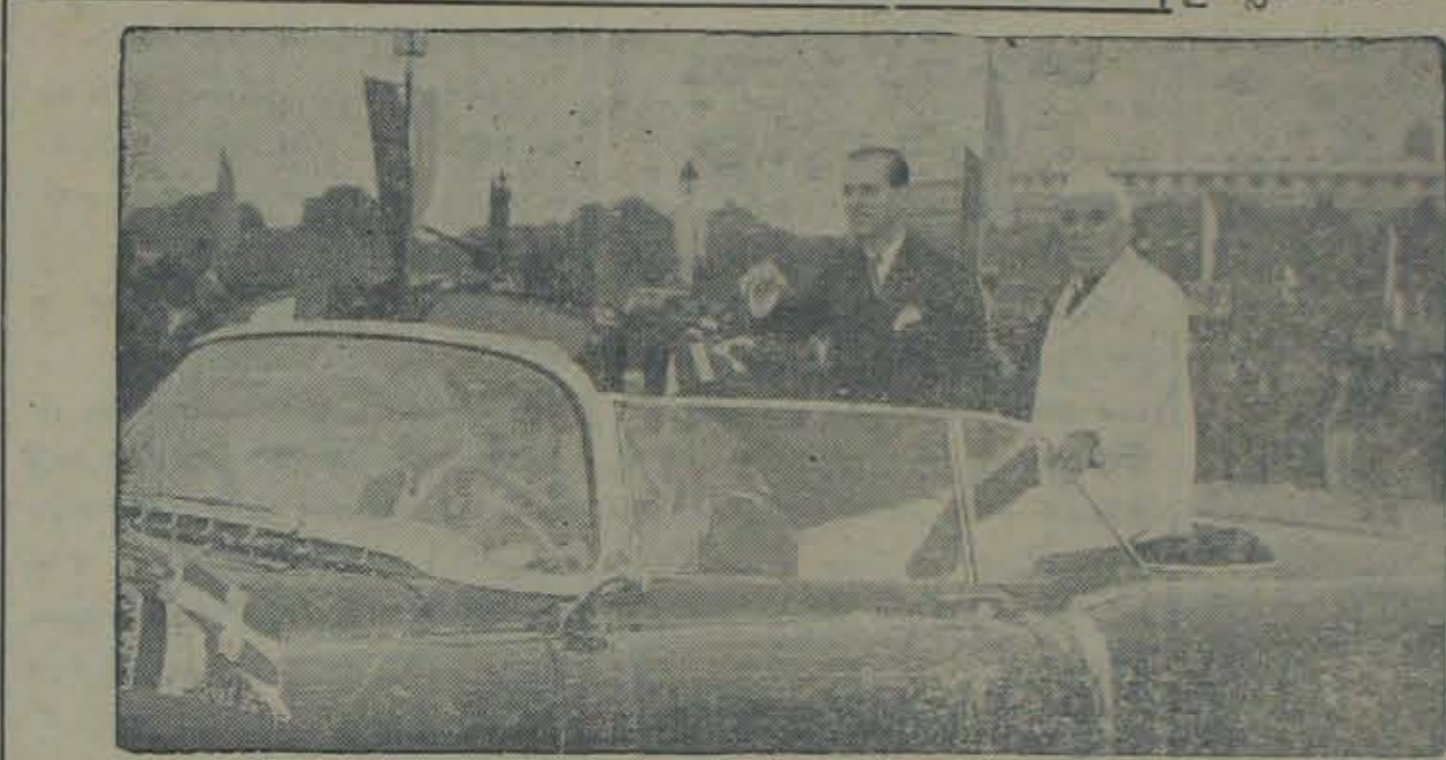
ప్రధాని నెహ్రూతో గూడా విమానాశ్రయం నుండి ఢిల్లీ రాజవీధులగుండా పోవడం చిత్రంలో చూడవచ్చు.

మిస్తున్నాము' అన్నారు. చెన్నారెడ్డి ఈజోహులన్ని అందుకుని కేరళ మా ర్గాన ఆంధ్ర పోతుండా వుండడానికి తనకడుం కాంగ్రెస్ నుంచి విడి