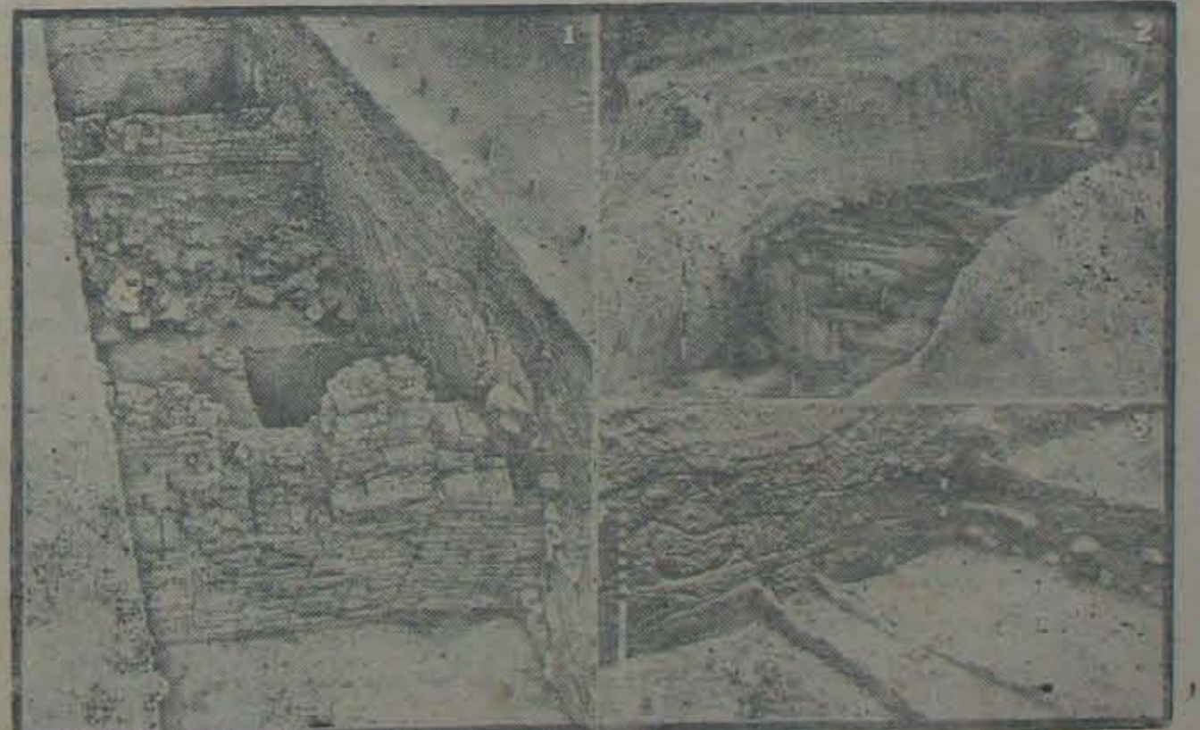
క్రీస్తుపూర్వం 500 నాటినుంచి మాల్యాలో ముస్లిం పరిపాలన ప్రారంభకాలం నాటినుండి వాజుగు ప్రాచీన వాగవికరణలు వర్ణించినట్లు శిల్పమునిలో గర్భనిల్వకర్త ఇటీవల జరిగిన క్రమ్యకాలలో జైతపడింది. ఇండియా కృషికి వురావస్తు లాభనారు యీ క్రమ్యకాలు హాగించారు. కీప్రాచీన తూర్పుకర్ణాటక మృగ్యులు ప్రాకారం ఒకటివుంది. 1వ దిక్రింలో క్రీస్తు పూర్వం 200, 500 మనస్య కాలానికి చెందిన ఒక గోడ విధిలాలన యాదవచ్చును. క్రీ. పూ. 200, క్రీ. ఆనంతరం 1200 మనస్యకాలంలో నిర్మించిన కుండవనోదయ నాణకర్ణున యాదవచ్చును. 2 వ దిక్రింలో మృగ్యులు ప్రాకారం ఒకే యాగ్నిక కోయ్యదుంకనన యాదవచ్చును. 3 వ దిక్రింలో పూవలకు గంతుకేనే హాయిగని యాదవచ్చును.