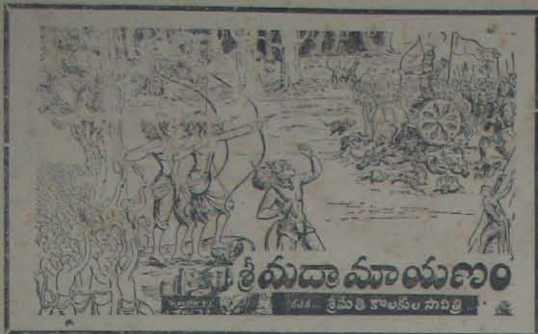
(గత సంచిక తరువాయి)

ఇట్లు వారు మాటాడుకొనుచుండగా మెలపులతో మేఘములను చదివెనొట్టుచు, సముద్రజలములకె గలచును, పుడమిని కదలించుచు నాకస్మిక్ముగా నోక గొప్ప పను గాని వీరను. అలివ్వుమై కెక్కలుకలిగిన గుర్రులకుండను గోచరించెను. ఆకాశము నుండి దిగివచ్చుచుండి గండంబునొగించిన కెంకెలమే కరకూపములుదాల్చి రానులత్తులులను గట్టియెన్న వివసర్పములన్నియు పయిగిడి మాయనయ్యెను. ఆ వివసర్పములు ఇంద్రజిత్తు మాయవలన కరకూపములుదాల్చి రాజపుత్రుల దేహముల బంధించెను. ఎక్కడు వాని గర్భశక్తువు గుండుడు కాన్పించెనో యిది వెంటనే ల. ఘించెను. తదుపరి గర్భశక్తువులు తన ఇనుకెలతో రానులత్తులుల దేహములు తడవగా వారి గాయములుమాని తొల్లింటి కట్టి వలల వచ్చెను. అన్నదమ్ములి కువురు బలశోభనములతో మున్నుకంటెను మిన్నయైన కేకోకాంతులతో విరాజిల్లుచు తది మార్పొనిరి. అంత క్రోరాముడు గరుడు నితో, "ఓయీ! నీ అనుగ్రహమువలన మాయాపద తొలకెను. నీవు నాకెంతయు నానందమును గూర్చితివి. ఓ ఉపకారీ! నీవెవడవు?", అని అడుగగా గర్భశక్తుడు ముదమొంది, "ఆర్యా! నేను నీకు ముఖ్యమగు నెలికాడను. ప్రాణి జరకాడను. మీరి తెలుగున నాగపాశ బంధులగుటను తెలిసికొని వానినుండి మిమ్ము విడిపింపవచ్చినాడను. నీకు జయమగుగాక! రామా! ఇప్పుడు నా నెలిమినిగూర్చి తెలియ నకేటపడవము. నన్నెప్పుడు తిరిగిపోవచ్చు. నీ సమరకార్యము ముగిసిన తదుపరి మన ఒండొరుల స్నేహముగూర్చి తెలిసికొనకలవు. నీవు రావణుని వధించి సంకట మొందకలవు", అని చెప్పి పక్షివేయి రామునికి ప్రదక్షిణము గావించి యాలింగనము చేసికొని గగనమార్గమున వెలిగిపోయెను. రానులత్తులకు పూర్తిగా స్వస్థత చేహాలుటనుగాంచి వానరులు మలల యుద్ధ సన్నద్ధులై గొప్ప పెట్టున సింహనాదములు గావించుచు భేరికంఠముల మ్రోగించుచు పరమాస్వాహమతో కోలాహలమునెయుచు నడికేయి లంకాపురకార్యములకడచేరి సరంధమునెయుచుండిరి.