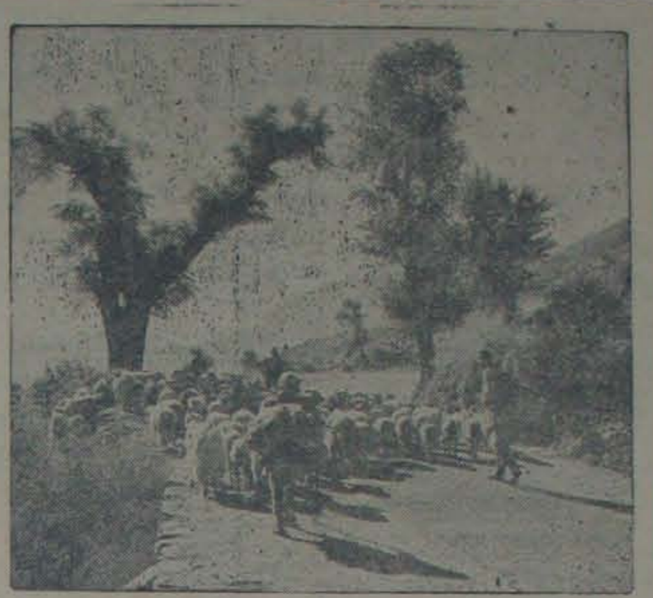
దేవతలలోయ అని ప్రసిద్ధి కెక్కిన కులు లోయలోని రమణయ ద్యుక్యాలలో అది ఒకటి. కులు పర్వతాలలో జీవించే ప్రజలకు గ్రెగెరి పెంపకం ముఖ్యమైన వృత్తి. వంజాబు పర్వత ప్రాంతాల లోని ప్రజలలో సుమారు మూడోవంతు మందికి యీ వృత్తివల్ల జీవనోపాధి లభిస్తోంది.

ప. యూరసీయ డెమాక్రసీని కాపేయడం లేకపోతే కమ్యూనిజంయొక్క అక్షయ లోన గావడం జరుగుతున్నది. రెండూ కార్యకాశీలే. వైకేవై పుకవ్యాసాలన్నీ బడా యి మాటలు. మనమంతా ఏదో క్రొత్తరకమైన