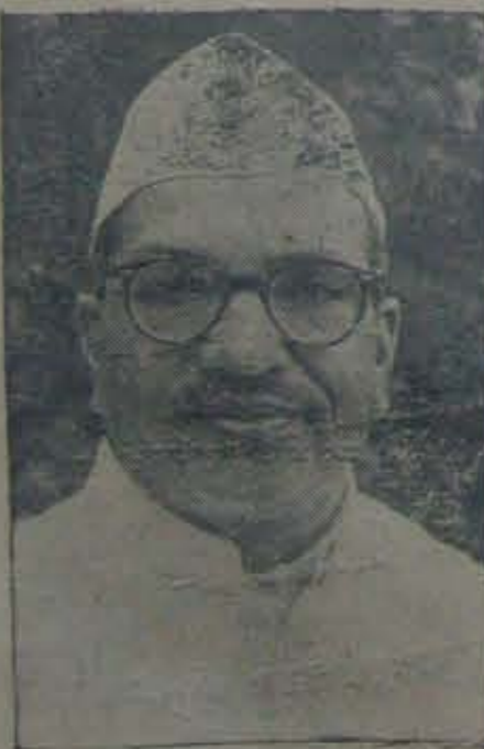
శేంద్ర ఆరోగ్య మంత్రి శ్రీ కర్కారావు