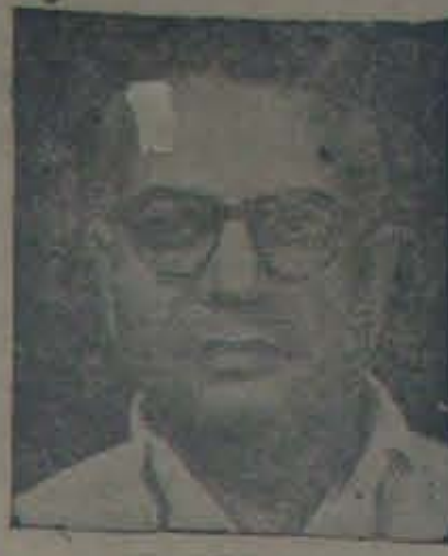
ఆర్థికమంత్రి శ్రీ కృష్ణమాచారి ముంద్రా కుంభకోణ బాధ్యత విరిమిదనే పడుతుందా?