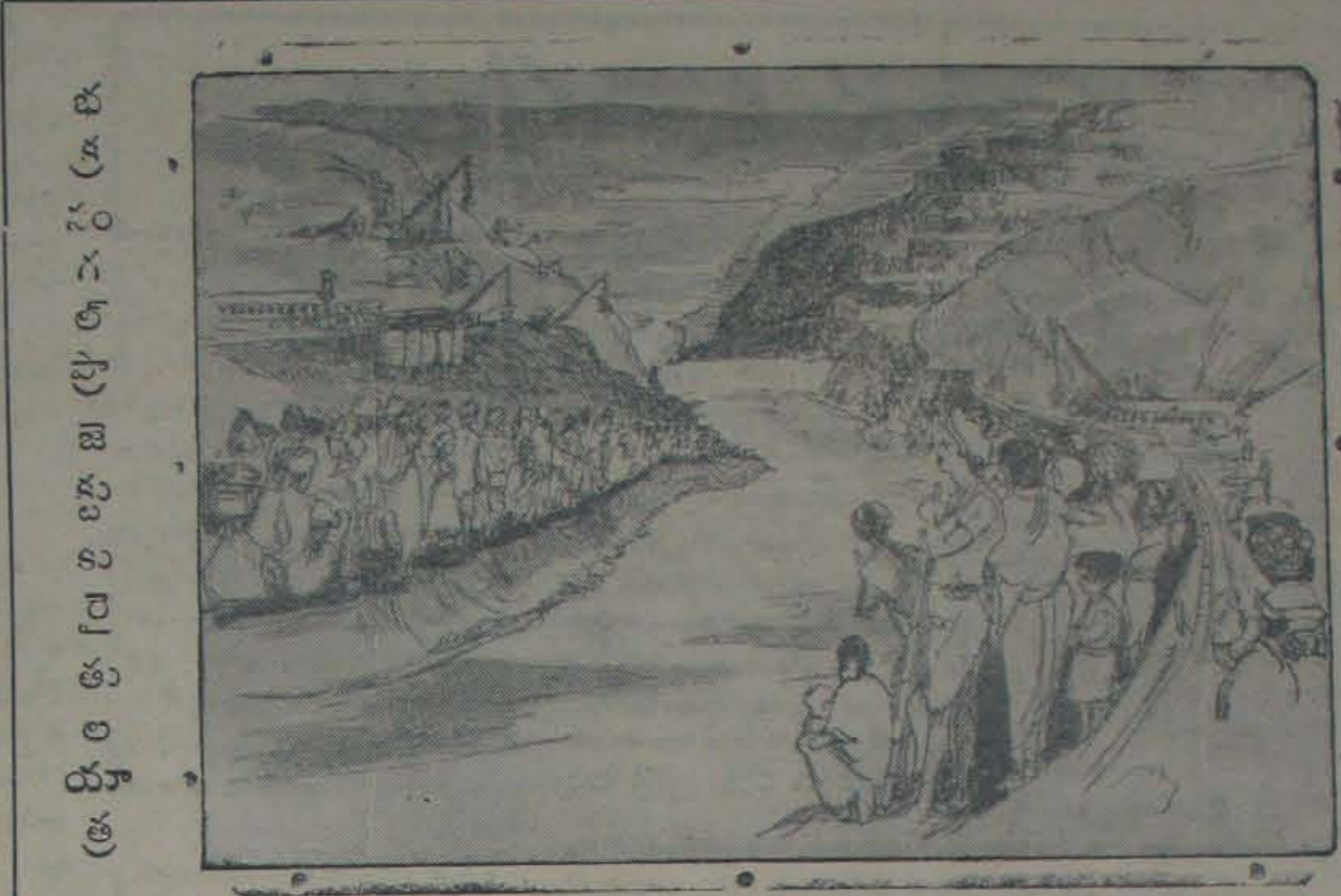
భూ సంస్కరణల చిల్ల: వివిధావిప్రాయాలు

నూటికి దాదాపు 95 గురు 15 యేకరముల లోపు భూమి కల్గిన వారని, యందులో నూటికి 80 మంది 5 యేకరములలోపు వారని ప్రభుత్వం లెక్కలే చెప్పవచ్చును. కనీసం 5 యేకరముల భూమిలేని వ్యవసాయ కుటుంబం కేవలసాధి జరుపుకొనుట కష్టము. 5 యేకరములలోపు భూమి కల్గినవారు మన రైతులలో నూటికి 80 మంది యున్నారు. గ్రామాలలో నూటికి కనీసం 30 కుటుంబాలు వ్యవసాయ కూలీలని తెలుస్తున్నది. ఇట్టి కుటుంబములలో నూటికి 70 మంది భూమియేలేదు. దక్షిణ ప్రాంతములో నూటికి 50 పల్లెటూరు లాంటి భూమిలేనవారు యిటీవల కొందరు తెల్పియున్నారు. వ్యవసాయదారులకే వ్యవసాయ కూలీలుగాడా సంవత్సరములో ఆరు మాసములు నిరుద్యోగులు. మన దేశంలో 35 కోట్ల వ్యవసాయ కూలీలున్నారు. అందులో