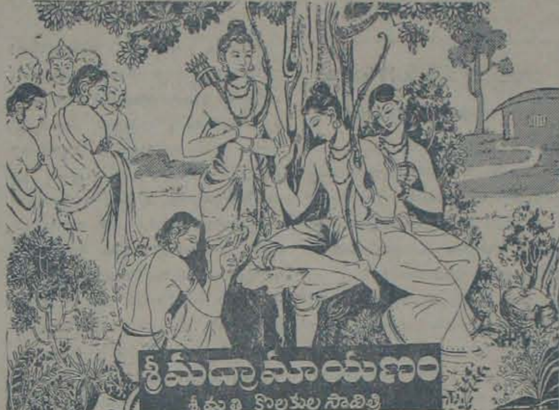
శ్రీమద్రామాయణం శ్రీమతి కులకుల సోదరిచి

"అదీ నా పనుల విని భయకంపితకుండ వైతిని. నా కరీము గడ గడ పడంకినది. నాచేతులనుండి ధనుర్మాసములు బాటి క్రింద