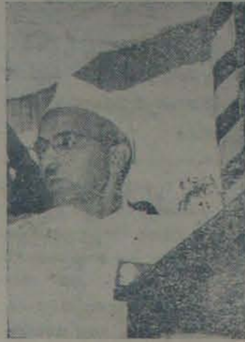
నారాయణరెడ్డిపేట కాలనీ నారాయణరెడ్డిపేట యానాది సంఘంలో ప్రవేశించి ఆక్కడ చల్ల యానాదుల పరిస్థితులను విచారించారు. ఒక ముసలి యానాదిని