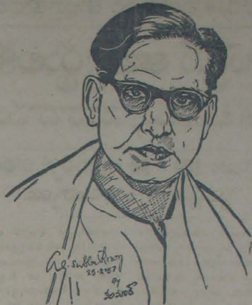
మునుపటి ఆదరాన్నే చూపండి

చాంచారి కంపెనీ నెల్లూరు పట్టణంలో విద్యుత్ సరఫరా చేస్తుండేప్పుడు లెట్టు అరిపోవడం చాలా అరుదుగా వుండేది. ఎప్పుడైనా పారపాటు జరిగితే ప్రజాభిప్రాయానికి వారు తలయొగ్గవారు. అటు పే ముట్ల ధర్మశర్మేశ్వర్ విద్యుచ్ఛక్తి సరఫరా చేస్తున్నప్పుడు కన్యూన్యమర్చు నుండి ఏ ఏర్పాదు వుండేదికాదు. కాని నేడు మర్చియ్యంబందం నుండి జరిగే విద్యుత్ సరఫరా చాలా అబందరగా వుండడం విచారకరమైన విషయం. ప్రతిదినం రాత్రినే 9 గంటలపాటు విద్యుత్ దీపాలు అరిపోతున్నవి. పరిశీలకు సిద్ధమాతున్న కాలేజీ, హైస్కూలు విద్యార్థులు అసౌకర్యం పాలౌతున్నారు. విద్యుత్ శాఖాధికారులు యీ అబందరను తొలగించుటకు తక్షణం కృషి