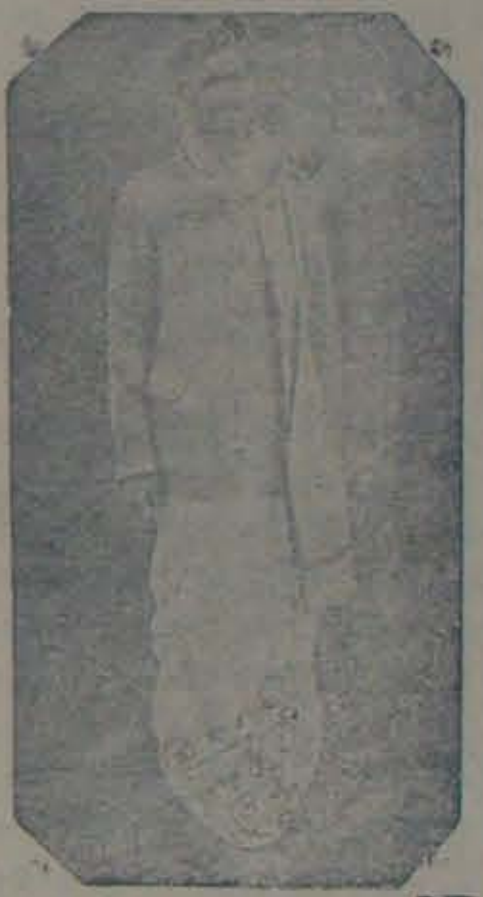
1937 లో మంత్రిగా శ్రీ గోపాలరెడ్డిగారు

అధికమంత్రి శ్రీ తలవార గోపాలరెడ్డి గారు 1937-లో ప్రవేశమైనా మంత్రియై ఇరవై సంవత్సరాలు నిండినవి. 1937 జూలై 14 తేదీ వారు కాటాకి మంత్రివర్గంలో స్థానిక స్వపరిపాలనా మంత్రిగా చేరారు. తర్వాతి అవిభక్త మద్రాసురాష్ట్రంలో అధికమంత్రిగా, ఆంధ్రలో ముఖ్యమంత్రిగా, ఆంధ్రప్రదేశ్ లో అధికమంత్రిగా వారు యా వాటికీ అధికారి ములో వున్నారు. ఈ ఇరవైసంవత్సరాలలో, మధ్యలో 27-10-1939 తేదీన కాటాకిమంత్రి వర్గం రాజీనామాచిచ్చిం తర్వాత, 1946-లో మద్రాసులో - 1953-లో ఆంధ్రలో ప్రభావంగా ముఖ్యమంత్రిగా వున్న పదుములో తప్ప, వారు మంత్రిగానే వుంటున్నారు. ఇంత కాలం మంత్రిగా వున్న ఏకైక ఆంధ్రుడు శ్రీ గోపాలరెడ్డిగారిక్కడే. తామ 20 ఏళ్ళవారు తొలిసారి మంత్రియైన దినం చందర్పాన్ని పురస్కరించుకొని శ్రీ గోపాలరెడ్డిగారు మొన్న 14 తేదీ హైదరాబాదులో పత్రికాసంపాదకులు, విలేకరులకు -కొరవ 9-వ కేటో-