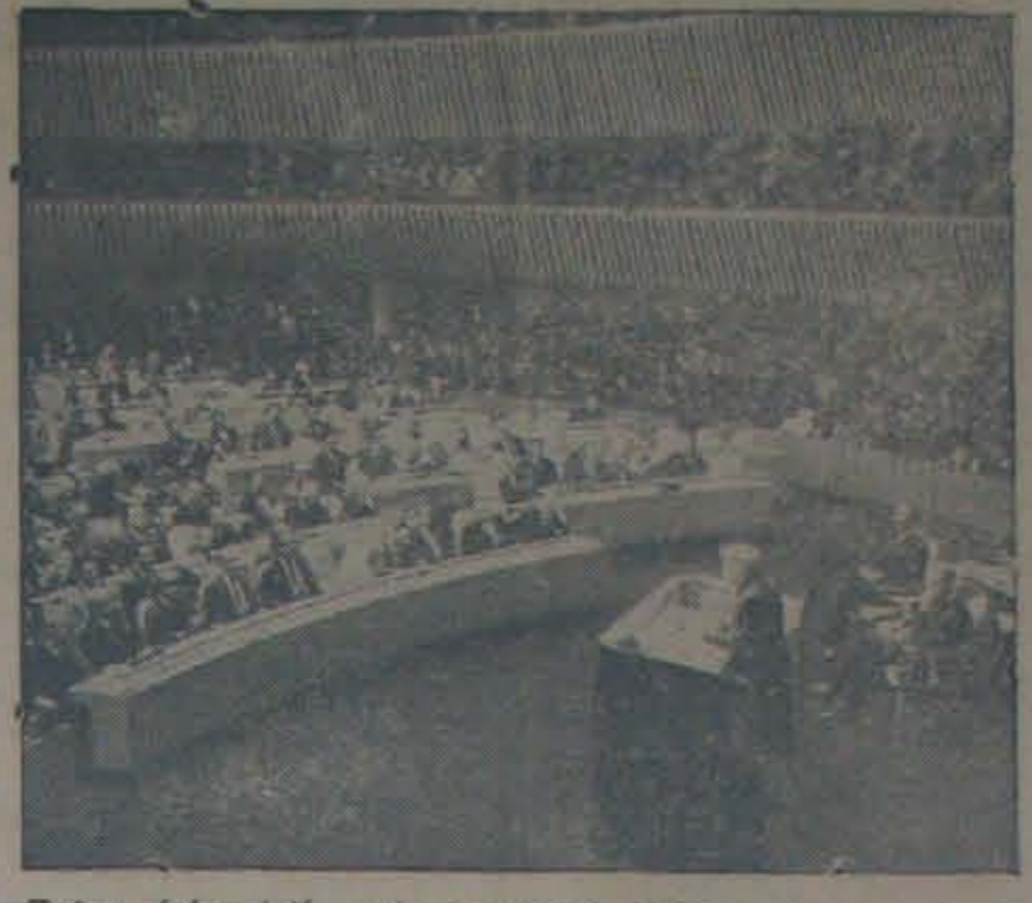
అమెరికా పర్యటనలో బక్యరాజ్యసమితి వేదికనుండి కాంతి సందేశం వినిపిస్తున్న భారత ప్రధాని పండిట్ నెహ్రూ

నుంచి తిరిగివచ్చిన అనంతరం, ప్రధాన మంత్రి రిద్దరూ ప్రభుత్వ వ్యవహారాలపై మద్దతు సమాలోచనలు జరిపారు. ఈ సారి శ్రీ నెహ్రూ లో జరిగిన సంప్రదింపులు చాల ప్రయోజనకరంగా ఉన్నవని శ్రీ చౌ.ఎ.కె. ప్రకటించారు. ఈ సమాలోచనవల్ల రెండుదేశాల సభ్యుల సెంపాందిందని చెప్పవచ్చును. అందువల్ల ఆశియాలో కాంతిరక్షణ బాధ్యతను ఈ