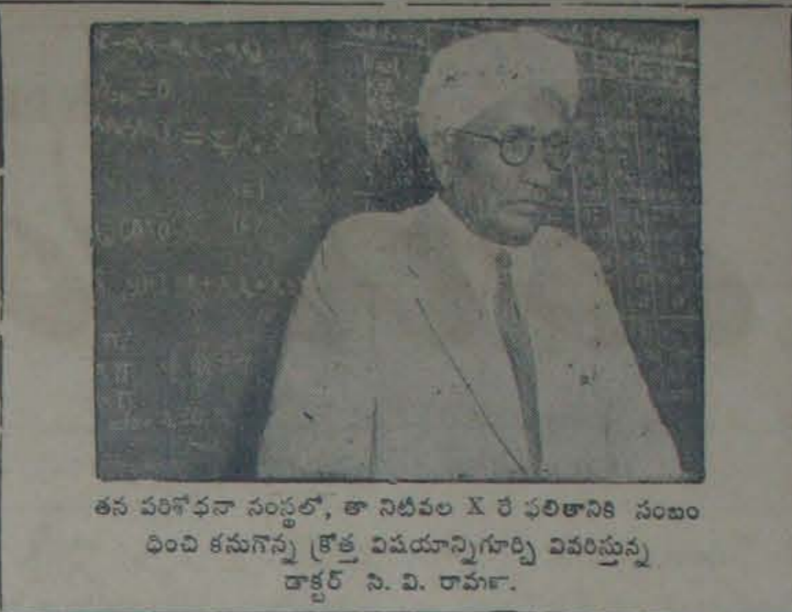
తన పరిశోధనా సంస్థలో, తా నిటివల X రే ఫలితానికి సంబంధించి కనుగొన్న క్రోత్ విషయాన్ని గూర్చి వివరిస్తున్న డాక్టర్ సి. వి. రామణ్.