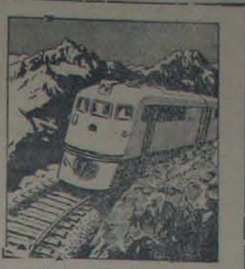
పృపంచములో ఆసాధారణ మైన రైలుమార్గం ఈ క్వడార్ కొండలలో వున్నది. 218 మైళ్ళ పొడవున్న యీ రైలు మార్గం, నముద్ర మట్టానికి 30 ఎత్తున వున్న పట్టణంనుండి బయలుదేరి, నముద్ర మట్టానికి 9,300 ఎత్తునవున్న రాజధాని నగరానికి చేరుతుంది.

మతం. శ్రీ నెహ్రూ సలహా మ పాటించి, తమలో తమకున్న వైమూర్తాలు, స్ఫుర్తులు ముతావలవనీ, కాంగ్రెసువారులవ్యవస్థలలో మార్పుతీసుకొని రాగలిగితే, కాంగ్రెసుసంస్థ పూర్వపుటన్నత్యాన్ని సాంబాధనముటలో ఏ మార్గం సందేహంలేదు.