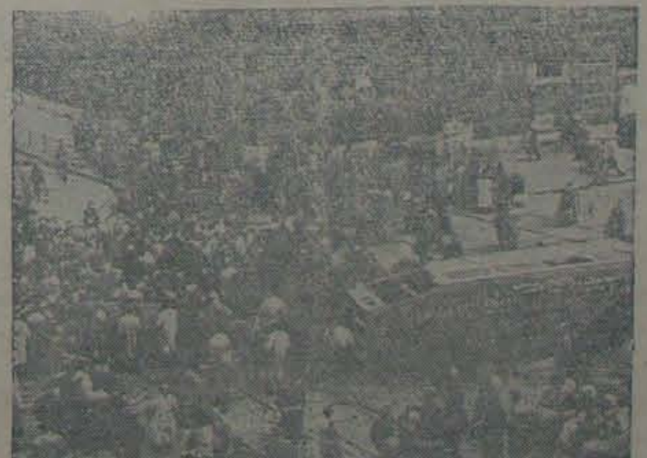
తిరుగుబాటుజేసిన ప్రజలు స్వేచ్ఛాపూరిత ఎన్నికలుకావాలని, రష్యావైర్యం వల్లపోవాలని ప్రాయోబద్ధకామితో ప్రారంభించుతున్నారు.