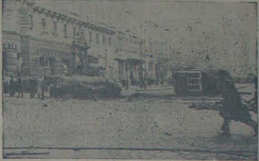
పదగొట్టబడిన స్టాలిన్ శిలాప్రతిమను విధులవెంట బాగుతున్నారు.

రష్యానిరంధకత్వానికి వ్యతిరేకంగా హంగరీ ప్రజలు తిరుగుబాటు జేసిన విషయం పాఠకులకు తెలిసిందే. ఈ తిరుగుబాటులో కాదాపు 13 వేల మంది హంగరీదేశభక్తులు రష్యాచే హతమార్చబడ్డారని అంచనా. ఈ దేశ భక్తులు కోరనే స్వేచ్ఛగా పశ్చిమలనే ఎన్నుకోబడే ప్రభుత్వము కావాలని, రష్యావైర్యం వైదొలగాలనేది మాత్రమే. హంగరీ దేశభక్తుల రష్యావ్యతిరేక చర్యలను తెలియజేసే మరికొన్ని చిత్రాలు దిగువ యిస్తున్నాము.