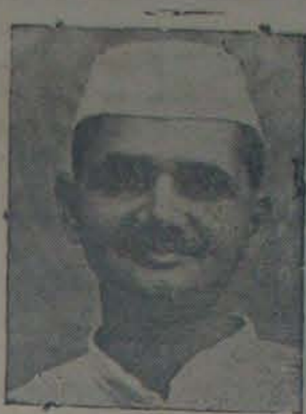
రాజీనామా చేసిన రైల్వే మంత్రి శ్రీ శాస్త్రి

ఇండియాకు విచ్చేయడం చూడించదగిన విషయం. వారిలో పాటు 150 లామాలు, ఎందరో బౌద్ధభిక్షువులు యిండియా సందర్శించారు. ఇంతకు పూర్వం ఏ విదేశీ సాంఘిక సంఘం యిండియాను పరిచారకల్పించడం ఎప్పుడూ ఇండియాకు విచ్చేసి యుండలేదేమో దలాయిలామా, చైనా రిపబ్లిక్ లో ఆంధ్రప్రదేశ్ లోని టిబెట్ అధ్యక్షులు. పాంచకలామా టిబెట్ మొదటి ఉపాధ్యక్షుడు. దలాయిలామా, పాంచకలామా లిరువురూ చైనా రిపబ్లిక్ ఉపాధ్యక్షులుగా వున్నారు. వారిరువురు బౌద్ధ మతస్థులు. లామాలు కమ్యూనిస్టు ప్రభుత్వం క్రింద ఎలా సజ్జతులైనా వేద బయట ప్రపంచానికి కొంత ఆసక్తి లేకపోలేదు. ఇరువురు లామాలు టిబెట్ ను వదలిరావడం జాస్తి టిబెట్ లో ప్రస్తుతం ముస్లిం మైనార్టీ వ్యవస్థ వున్నట్లు, ఆసంకల్పిత బౌద్ధులు తనట్లు సువిధత మాకున్నది. ప్రభుత్వమే తిరిగి విధానానికి అలవాటుబడిన లామా లలో కొందరు, చైనాలో కమ్యూనిస్టులు ప్రవేశపెడుతున్న మార్కులకు సమ్మతించుటలేదట. మొదటి మహోద్యమం లామాలకు సంపదించిన అన్యాయాన్ని, అది అసహనం కాబట్టి, చైనా ప్రభుత్వం ఆంగీకరించదగినందున, భారత ప్రభుత్వమే చైనా ప్రభుత్వం ద్వారా అన్యాయాలను పంపగా ఆమోదించబడినవి.