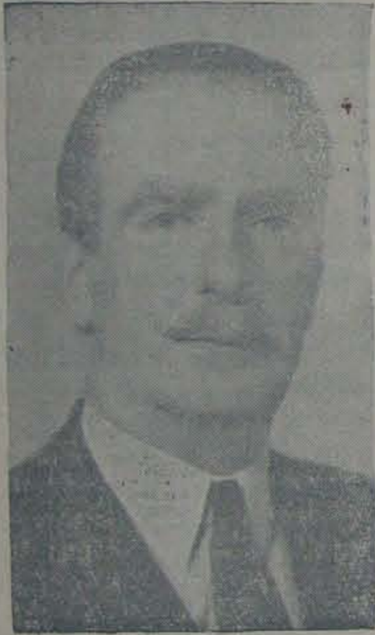
విశ్రాంతి పేరుతో వైదొలగిన బ్రిటిష్ ప్రధాని ఈడెక్

ఎక్కడనో వున్న జ. మై కా లో పూర్తి విక్రంతితునుకోమని బ్రిటిష్ ప్రధాని ఈడెక్ భుక్తాక్షు సలహాయచ్చినట్లు డౌనింగ్ స్ట్రీట్ నెం. 10 యింటనుండి ప్రకటన రావడం అందరినీ ఆశ్చర్యపరచింది. దీనినిబట్టి, ఈ డెక్ పదవీరముగా చేయవచ్చునాడనేది స్పష్టమారు న్నది. పోర్టుస్యూల్ నుండి బ్రిటిష్ సేనల తర లింపుతో పాటు రంగంనుండి ఈడెక్ నిష్క్ర మించడం ఒకేసారి జరుగుచుండుట గమనా న్నది. నాజర్ ను పదవీభ్రష్టుణ్ణి చేయబోయి, ఈడెక్ పదవీభ్రష్టుడు అయ్యాడు. ఈ డెక్