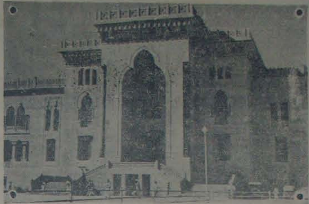
ఉస్మానియా విశ్వవిద్యాలయం, హైదరాబాదు

గంభీరమైన ప్రభుత్వ కార్యాలయముల తోడను, శిల్పకళావైభవములకు పృఖ్యాతి గాంచిన రాజప్రాసాదములతోడను, పెద్ద పెద్ద సరస్సులతోడను, వెదల్పుయిన గోడలతోడను, రమణీయమగు ఉద్యానవనముల తోడను హైదరాబాదునగరం చూపులకు