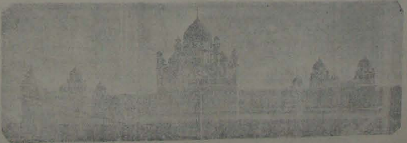
ఆంధ్రప్రదేశ్ హైకోర్టు - మైదరాబాద్

★ శ్రీ. పి. సి. కుర్రారెడ్డిగారి మంత్రిత్వం తేరుదడం వెళ్ళుచుండి ఆశాభంగం కల్గించింది. కుర్రారెడ్డిగారికి యిది కొంత అనిమేషం భావించగాని, వారి అనుచరులకు తీరని నిరుత్సాహాన్ని కల్గించింది. పలుకుబడి, పర్సనాలిటీ, చొరవ, సామర్థ్యం కలిగి, పరిపాలనలో మంచిచేరు కచ్చుకోన్న ఈవ్యక్తి మంత్రివర్గంలోకి తీసుకోబడకుండా, అన్ని విషయాల్లో చెడ్డకేయందే బ్రహ్మానందరెడ్డిగారికి స్థానంకల్పించడం, ప్రజాసేవ చేసే పని వలసివుంటుంది. మంత్రిల నిర్ణయమే యింత అపవర్ణంగావుంటే, యిక్కడ పాలన ఎంత బాగా వుండవోతుందో యాదంబి!