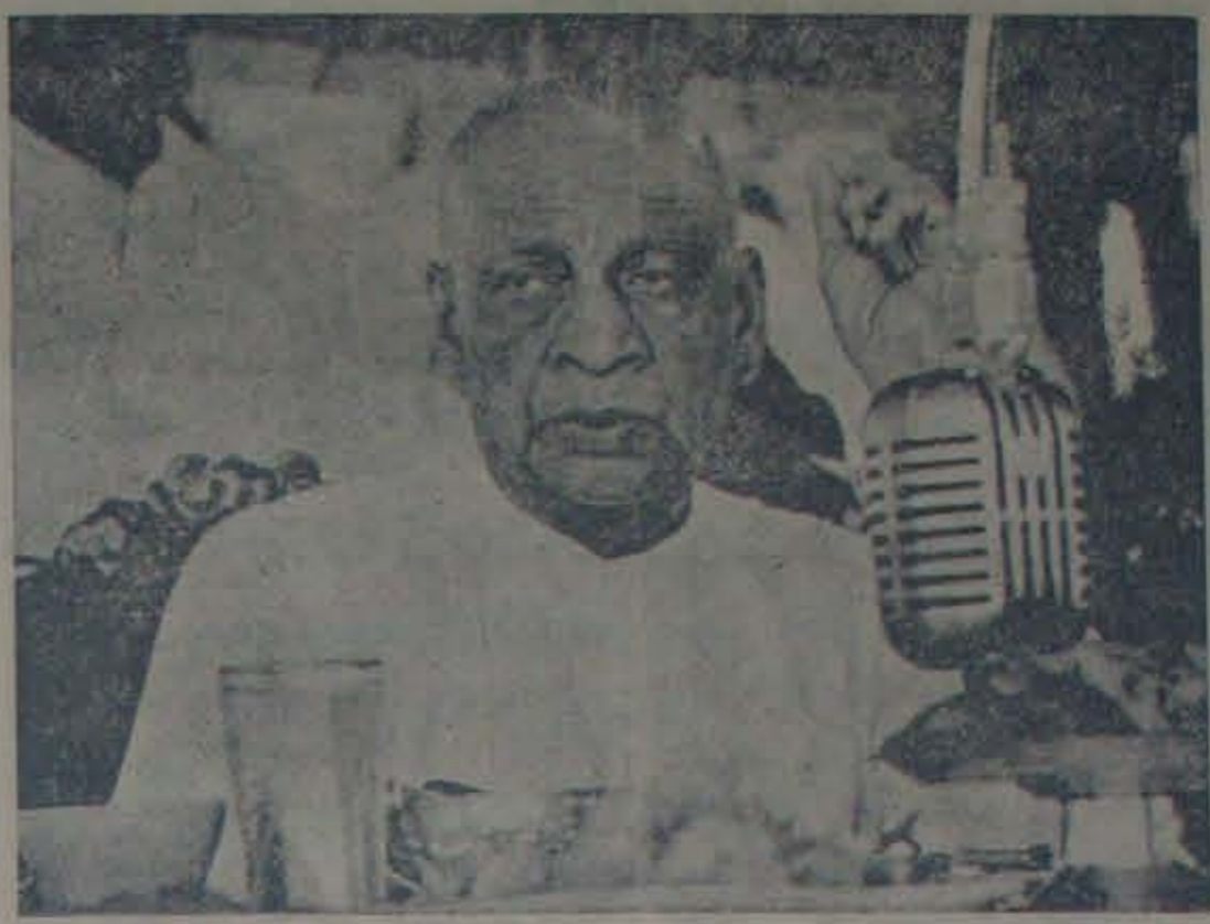
ఈనాడు తెలంగాణ ఆంధ్రలో విలీనమౌతున్నదంటే, హైదరాబాదును భారతదేశభాగంగా చేయడంలో సర్దారు పట్టేల చూపిన రాజనీతిజ్ఞతే కారణం.

ఆంధ్ర రాజ్యం సకలసంపదలకు, విద్యలకు, కళలకు నిలయమై, పూర్వపు మహోన్నతస్థితిని తిరుగా అందుకోసుగాక!