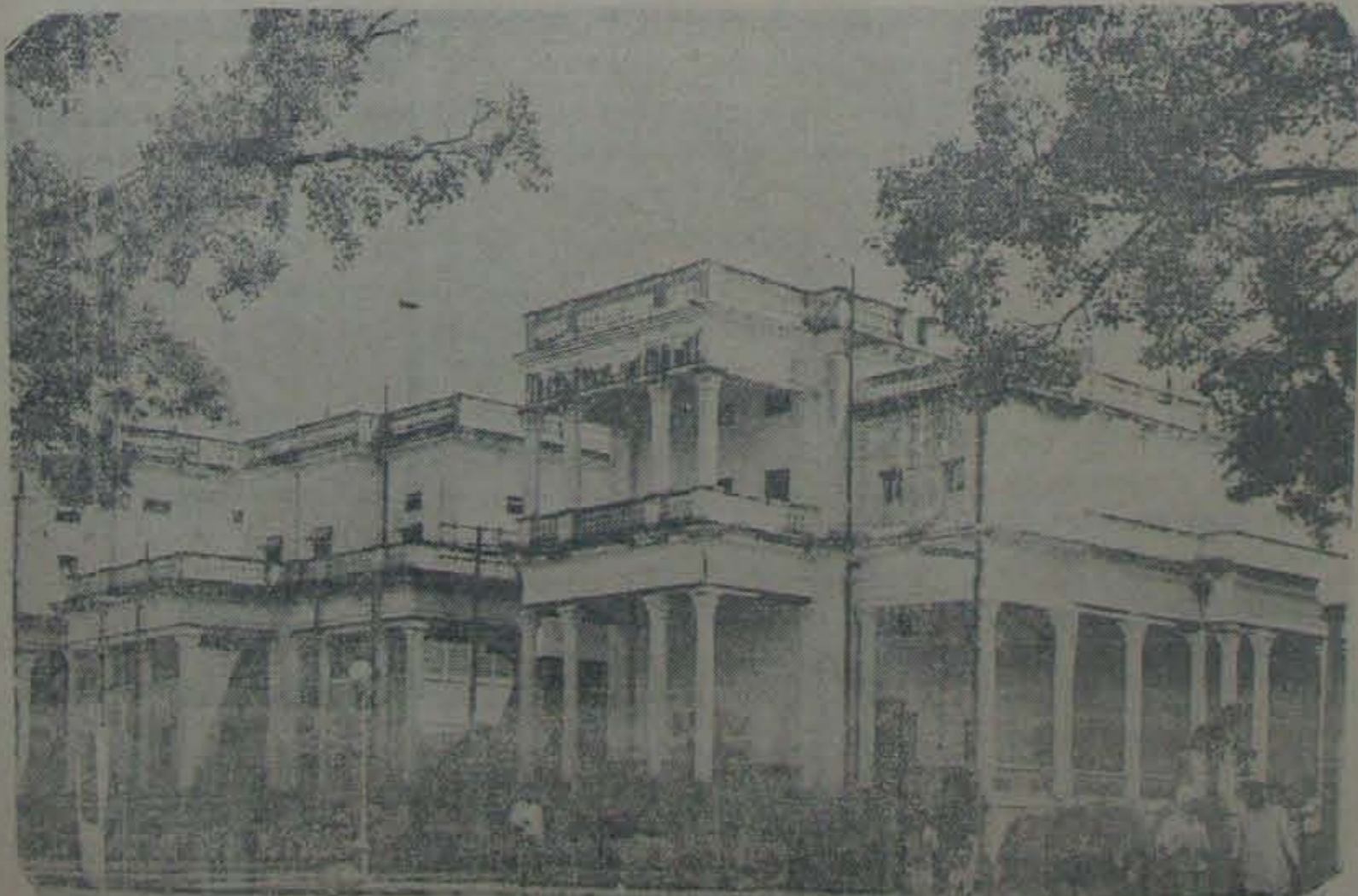
హైదరాబాద్ లోని రాష్ట్రప్రభుత్వ ప్రధాన కార్యాలయం

ఈ జంటనగరములు మహాంధ్రలో పృముఖప్రాత్ర వహిస్తూ, దిగకాలం పర్వత, చరిత్రప్రసిద్ధి నొందుగా!