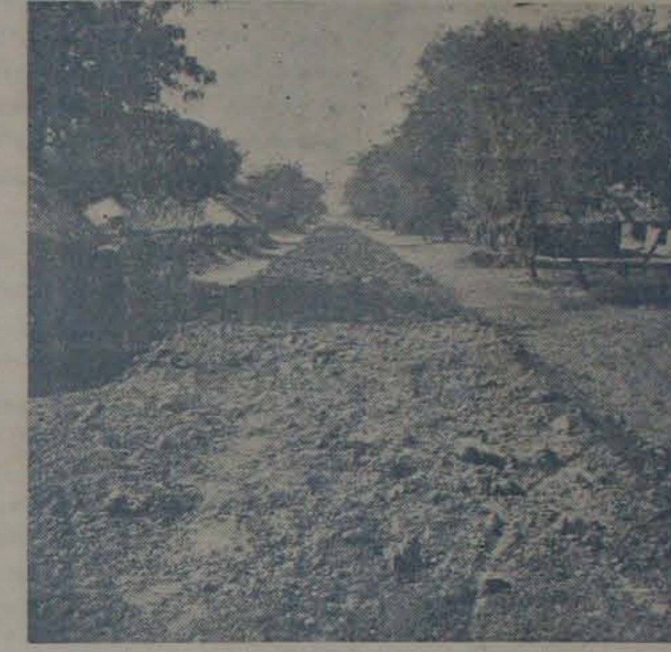
విద్యార్థులు నిర్మించిన మట్టిరోడ్డు