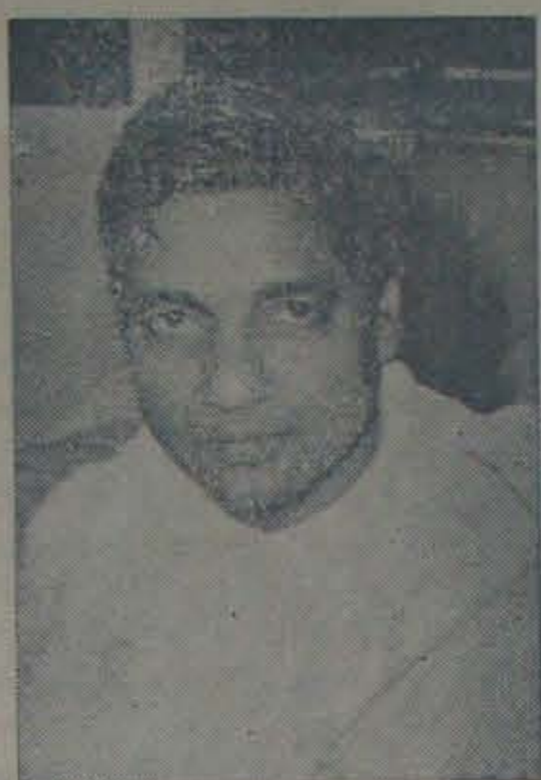
రైతులు శ్రోత్ర విషయాలు తెలుసుకొని గలగు తారని మంత్రిగారు తెలుపుచున్నారు.

సంవత్సర ప్రణాళికలను గూర్చి చంద్రమౌళిగారు వివరించారు. వ్యవసాయం రాజీయాలను ఆకలి మల్లెపూసలయ్యగారు ప్రభుత్వం అన్ని విధాల తోడ్పడుతుందని, రైతులను ప్రభుత్వ దృష్టికి తెచ్చి సహాయం చేయాలని, యిట్టి ప్రయోజనములను