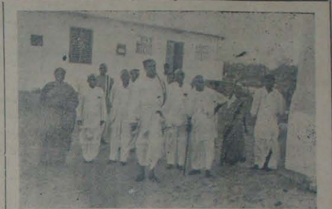
నెల్లూరులో శ్రీ కమూరిదేవి విద్యాలయ మాతృ భవనాలను పరిశీలిస్తున్న ముఖ్యమంత్రి డాక్టర్ బెజవాడ గోపాలరెడ్డిగారు.

ప్రత్యేక రాష్ట్ర కాంగ్రెస్ సంఘమున్న దానివల్ల ఎన్నో చిక్కులున్నాయి. ఎన్నికలలో ఆధ్యక్షుల నిర్ణయంలోనేగాదు, ప్రతినిధి యంతోనూ ఆలావుండడం నిర్ణయాత్మకమే. అవసరమైతే తెలంగాణా ప్రాంతీయ కార్యాలయం పెట్టుకోవచ్చు. ఆంధ్ర కాంగ్రెస్ సంఘంలోనూ, అందుచేతులలో తేలి రాయలసీమ, విశాఖకర్ణాటక అసంతృప్తుల విశాఖకర్ణాటకలలో ప్రాంతీయ కార్యాలయాలండేవి. వుపాధ్యక్షులలో, కార్యదర్శులలో వీటిని నిర్వహించవచ్చు. ఇలాంటి ఏర్పాటులైనా బాగుంటుంది కాని, ఏకరాష్ట్రంలో రెండు రాష్ట్ర కాంగ్రెస్ సంఘాలు స్వయంక్రమంగా