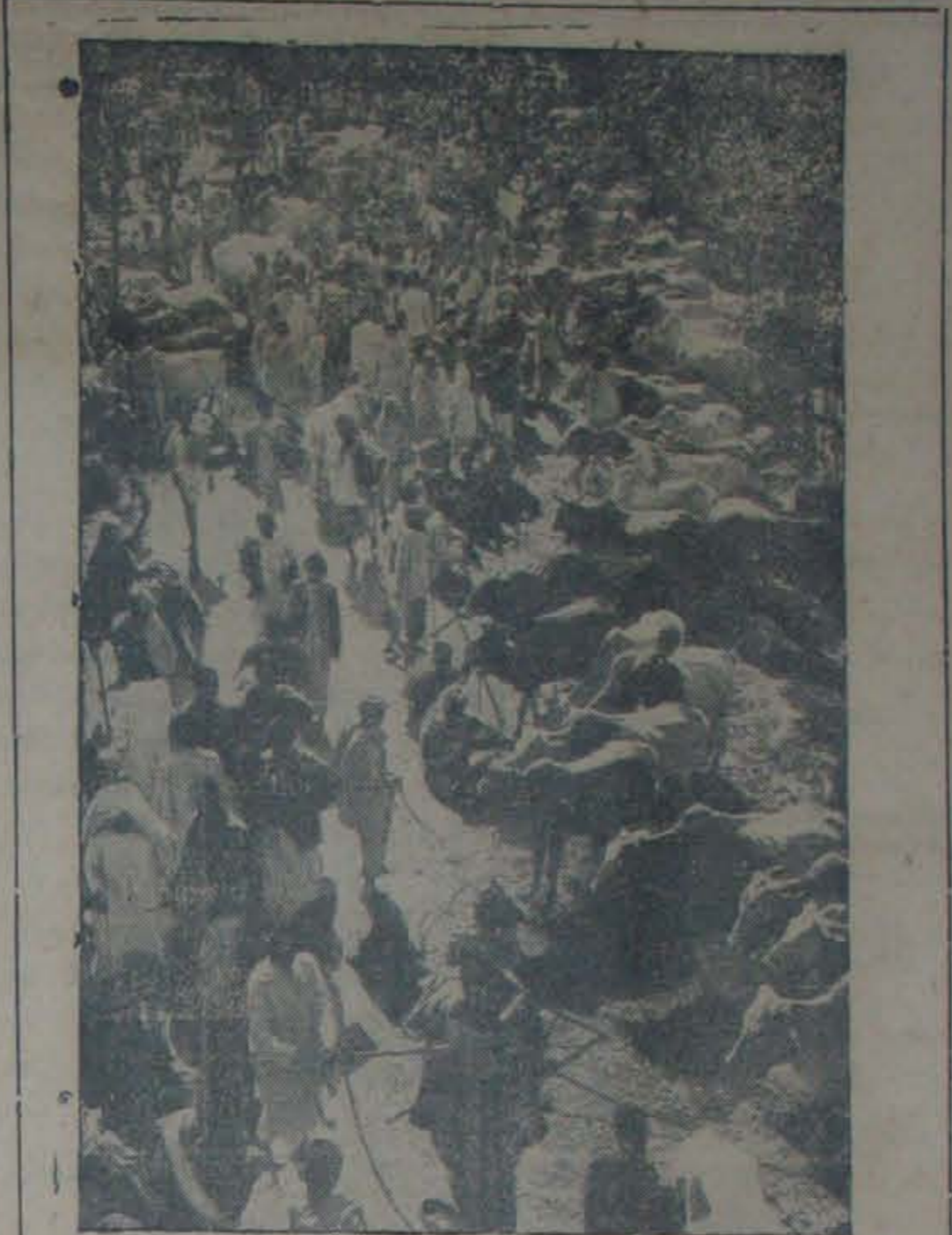
మనదేశ పశుసంపద 15 కోట్ల 55 లక్షలు. అంటే యిది ప్రపంచ పశుసంపదలో నాల్గవ భాగమన్నమాట. కాని పాలివ్యధంలో మాత్రం మన పశువులు అన్ని దేశాలకంటే వెనుకబడ్డాయి. పశుగణాభివృద్ధికి పాడివరిగ్రామ పెంపకానికి మన పంచవర్ష ప్రణాళికలో ప్రాధాన్యమివ్వబడింది. బీహారు రాష్ట్రంలోని సోనే పూర్ లో ఏర్పాటుైన ఒక పశువుల సంఠను యీ చిత్రంలో చూడవచ్చు.

యెస్టేటుపది నిర్వచనములో యినాము గ్రామములోని యెట్టి భాగమైనను యెస్టేటుగా నిర్వచింపబడినది. యినాము గ్రామం యెస్టేటు అని సెక్షన్ 3 (2) డి 1 లో చెప్పబడినది. 3 (2) D II లో యినాములోని యెట్టి భాగమైనను అని వున్నది. అంటే ఆ గ్రామం యినాంగా యివ్వబడిన గ్రామమై వుండాలి. తరువాత ఆ గ్రామంలో ఒక భాగమై ఉండవలయును. యినాము గ్రామాన్ని యెస్టేటు అని నిర్వచించిన తరువాత, యినాం గ్రామంలోని భాగం గూడ యెస్టేటు అని నిర్వచించడంలో కొంత చిక్క వర్పడినది. ఎట్టి యెస్టేటులందు ఆర్థిక జమీందారీ గ్రామాలకు యినాము గ్రామాలకు ఆదిలో యెస్టేటు కాబడియున్నది. ఒక జమీందారీ గ్రామంలో 3/4 వంతులు యినాముగా యివ్వబడినచో యీ బిల్లు ప్రకారం అది యెస్టేటు కాకుండా చావుటకు పావకాకంవున్నది. 3 (2) డి II లో యినాం గ్రామములోని యెట్టి భాగమైనా అని చెప్పబడినచో గాని, జమీందారీ గ్రామములోని యెట్టి భాగమైనా అని చెప్పబడి యుండలేదు. రైతులు అపాదినుండి ఆంధ్ర శివచేయుచున్నది యెట్టి యినాములన్నింటిని