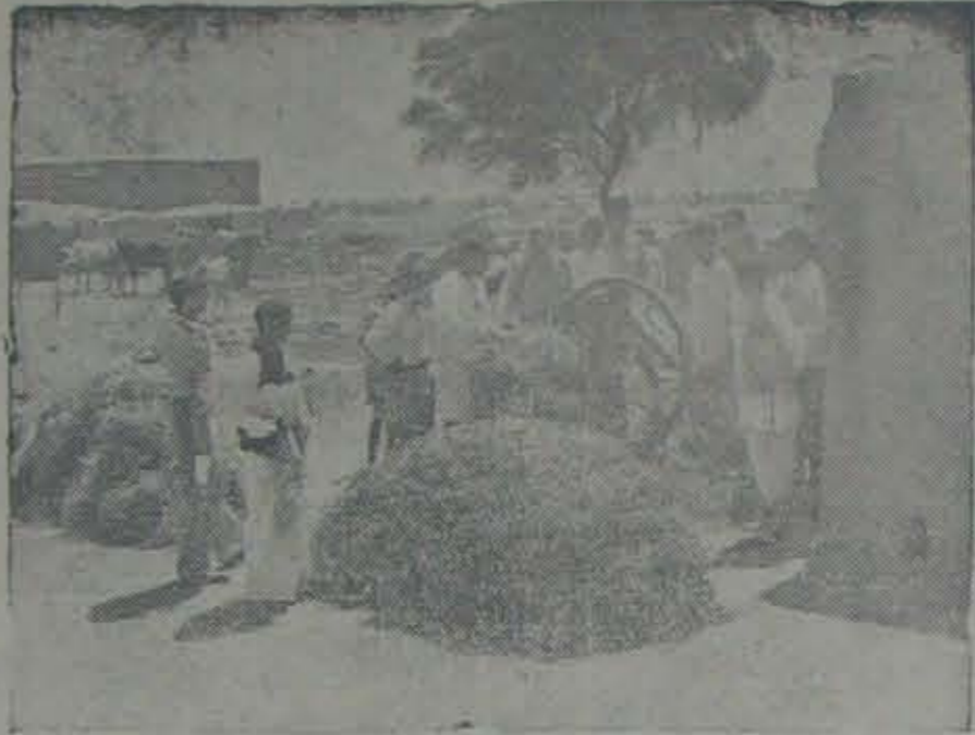
కురుక్షేత్రం కమ్యూనిటీ ప్రాజెక్టు ప్రాంతములో చేరిన ఆనంద సహకార వ్యవసాయ క్షేత్రం ఎలా పనిచేస్తున్నది రైతులు పరిశీలిస్తున్నారు.