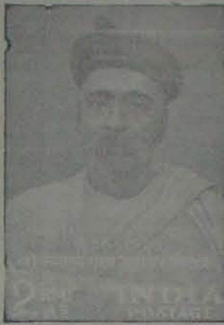
తీలక్ శతవార్షిక జయంత్యుత్సవ సందర్భమును పురస్థరించుకొని భారత ప్రభుత్వం ప్రచురించిన ప్రత్యేక తపాలాబిళ్ల