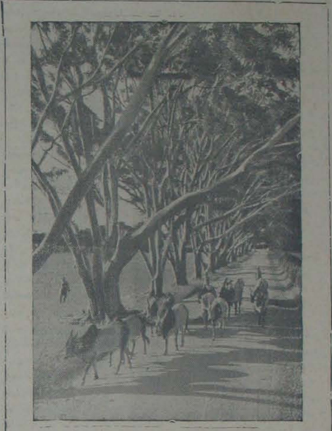
ద్వితీయ పంచవత్తు పరీక్షాకేంద్రంలోని అటవీ, వృక్షసంపద పెంపొందించుటకు. 24 కోట్లు వ్యయం చేయబోతున్నారు. రిలీఫ్ల ఎకరాలలో అటవీ సంపద పెంపొందించుట, రిలీఫ్ల ఎకరాలపాఠశాలలో కొత్త చెట్లను నాటు కార్యక్రమం కొనసాగుతుంది. ఇటుప్రక్కల వృక్షముల వరుసలో ఆలరాధులను మైసూరు రాజమార్గమును యీచిత్రిలో చూడవచ్చు.

సహకార వ్యవసాయవిధాన మొక్కటి ఆభ్యుదయకరమైనదనీ, సోషలిస్టు సామాజిక వ్యవస్థలో ధూమిని జీవితవిధానంగా, జీవన మార్గంగా వినియోగించుకోనే సరైనమార్గమని భావించడం జీవలం పారపాటుకాగలదు. ఆభ్యుదయకరమైన మార్గాలలో ధూమిని వినియోగ పెట్టుకోజేయకు సహకార విధానం గూడా ఒకటని ఆంగీకరించక తప్పదు. అట్టి ఎట్టిదోపిడిలేకుండా స్వంతసేద్యం కొనసాగించడం గూడ ఆభ్యుదయకరమైన వ్యవస్థయను నదిగూడా తప్పక ఆంగీకరించవలసియుంది. సహకార వ్యవసాయవిధానంలో, కత్తివంచన లేకుండా పనిచేయించే యజమానియి, బాధ్యత, నిర్వాహకులు పథ్యుల మధ్య సంబంధాలు, ఆ సంఘంలోని పాలకవర్గ నియంతృత్వం, వ్యవస్థలలో అధిక వ్యవసాయావలంబి నిత్యం ఆపరిష్కృతంగా మిగిలిపోయే గడ్డుసమస్యలున్నాయనే విషయం విస్తరించరాదు. కాగా స్వంత వ్యవసాయపద్ధతిలో యీ దుస్థితిజాలు లేవు. వేరనాలుబొందే కూలీలకు, ఉద్యోగులకు