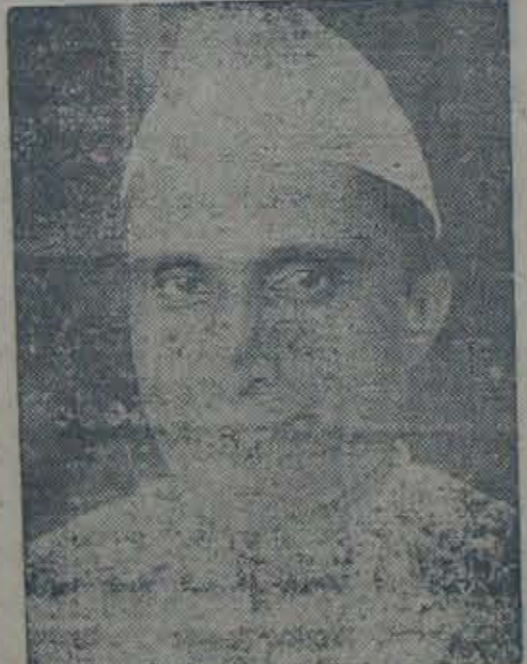
తెలంగాణా కుట్రలో కలసిన ఎస్. కె. పాటిల్