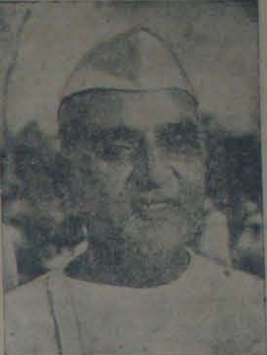
శిక్కులకు విశ్వాసం కలిగించు పంజాబు ముఖ్యమంత్రి త్యాగంజెసిన శ్రీ భీమసేన్ సచార్