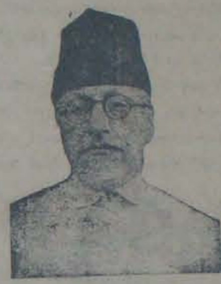
తెలంగాణా వాదులకు ఫరోకింగా సహాయపడుతున్న అగ్రనాయకుడు ఆజాద్

నోలుకే వైఖానవాలు వికలాంధ్రీకు అను కూలుడని వినిపించింది. కాని చూడకోలే