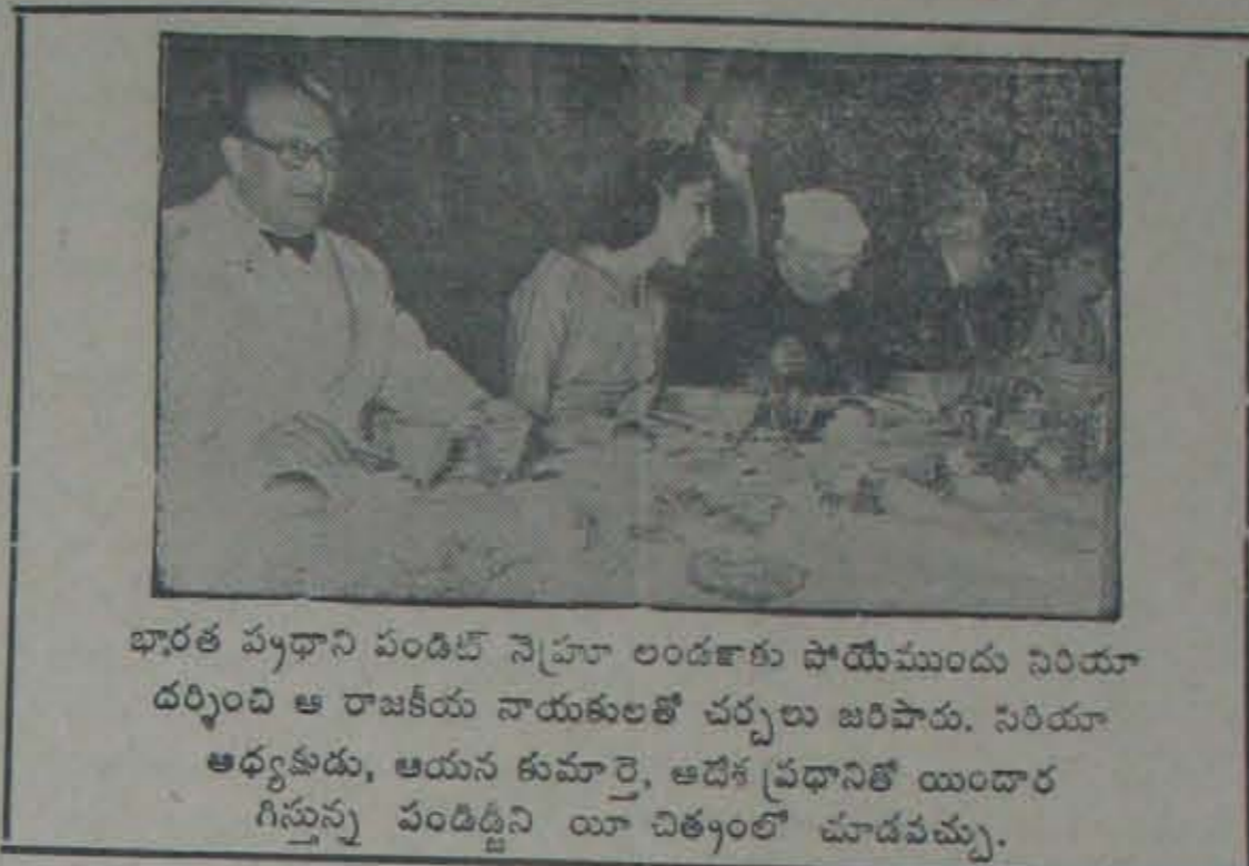
భారత ప్రధాని పండిట్ నెహ్రూ లండన్ కు పోయేముందు సిరియా దర్శించి ఆ రాజకీయ నాయకులతో చర్చలు జరిపారు. సిరియా అధ్యక్షుడు, ఆయన కుమార్తె, ఆదేశ ప్రధానితో యిందార గిస్తున్న పండిట్ ని యీ చిత్రంలో చూడవచ్చు.

వీధుల్లో ఆడవాళ్లు మనకెప్పుడూ కనుపించరు. ఒకే వేళ కనుపించినా ముసుగు లా మునిగిపోయివుంటారు. స్త్రీలను నాలుగు గోడలమధ్య బురఖాల్లో కట్టిపెట్టివేళారు. బహుభార్యావివాహాలు మెండు. ఎన్నో యోగ్యములవారు ముక్కుచచ్చులారని ముగదల్చి మట్టిపెళ్లి చేసుకోంటున్నారు కూడా.