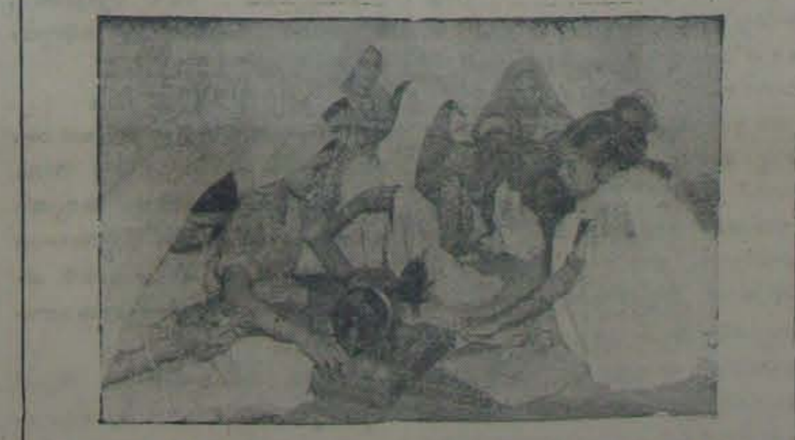
బేపల్ అనే గ్రామంలో త్రలో మహిళలు ప్రవ్రథమంగా బయటకొచ్చి కుట్టువనిలో శిశుబాంధువులు.