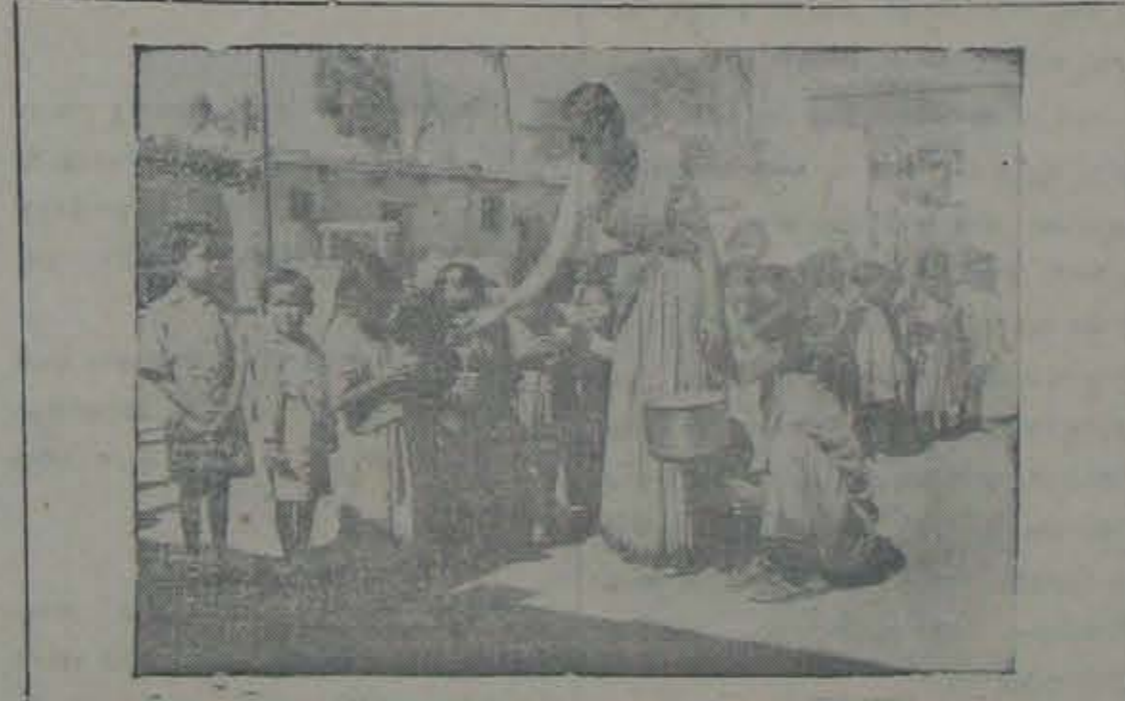
గౌరవాభ్యుదయ కార్యక్రమం చురుకుగా జరుగుతున్నది. బెంగుళూరు వద్ద కడెగల్లి గ్రామంలో పిల్లలకు పాల పంపకం జరుగుతున్నది.

1955 లో మూడు 8,00,00,000 ఎకరాలలో 3,18,40,000 బుషెలుల తొన్న పండింది. 1930 లో 10,10,00,000 ఎకరాలలో పండిన తొన్న పంట 208,00,00,000 బుషెలులు.