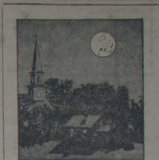
“చంద్రమండలంలో మావూరు” చంద్రమండలం భాగం కైగల వల్ల వ్యాంతాల, చంద్రుని వ్యూహం ప్రారంభం కరణం చంద్రగోళం వై భాగాన్ని తాకుతూవుండే గ్రహముల మయామాలలర్థ ప్రావిధ్య తమై న మచ్చలు.