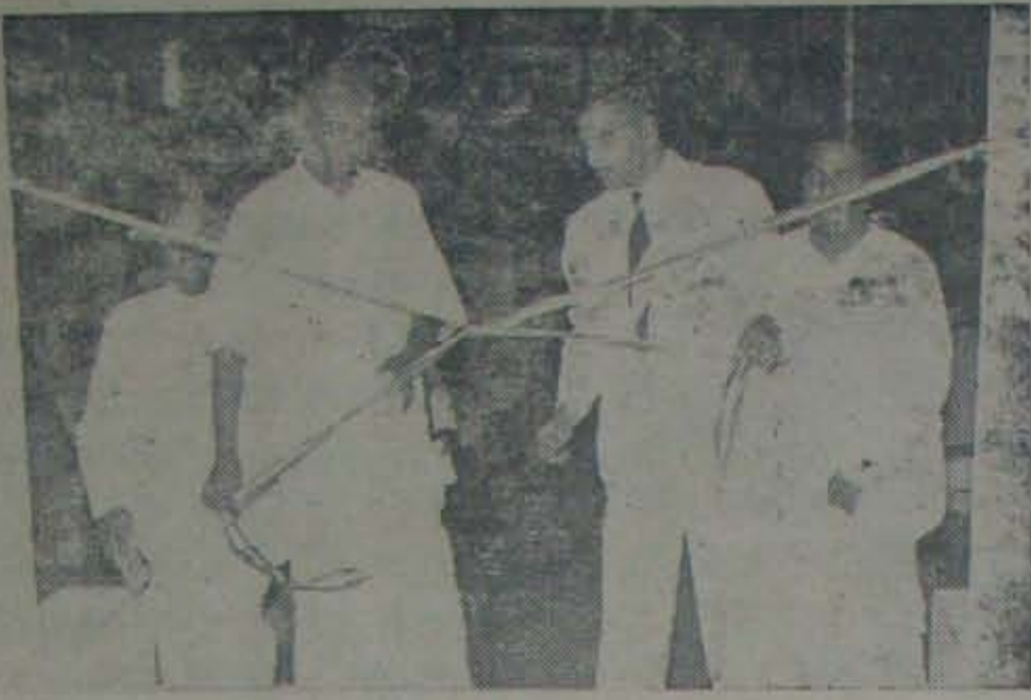
సత్య ప్రాగారంభోత్సవం గావిస్తున్న మద్యాను ముఖ్యమంత్రి శ్రీ కామరాజు నాథార్