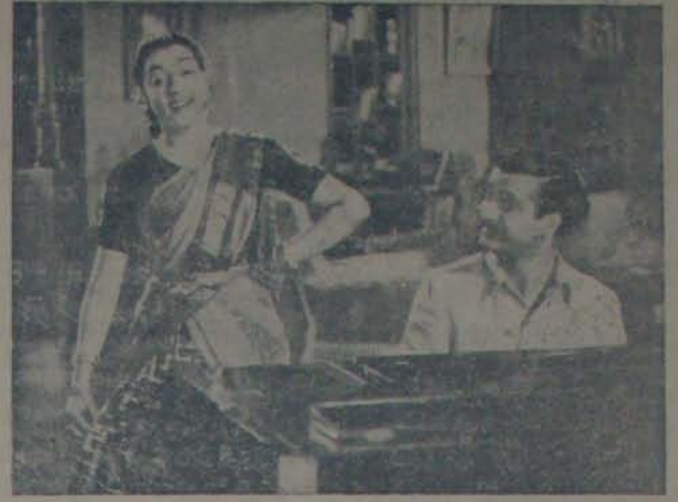
"మగువలెవుడుపుమగవారిని చిరునవ్వుల గెలవాలని తెలుసుకొనవెయుపట్టి - ఆలా నడచుకొనవెయుపట్టి" 'మిస్సమ్మ' లో రామారావుసందేశం. రామారావు, జమున.

ప్ర: అప్పజే కురంబాయాం? భీమసింగ్! ప్ర: కేశవ నెల్లూరు ప్ర: సినిమాలో భాషను కొరకపోతే నాటకాలలో దీనిన తువ తా రా తు లు లు నాటకాలలో భాషను కొరకపోతే ఏమి చేస్తారండీ? ప్ర: కలకత్తా సెయింట్ ఎక్స్ కుట్టింటికి కేవలం వంటాడు. ప్ర: హెచ్. శ్రీనివాసరావు శ్రీనివాసవరం ప్ర: కత్తి, కలం - ఈ రెండు కత్తులలో ఏది గొప్పదీ? వివరించండి. ప్ర: కలం. కత్తికి ఒక్కటే అయి, కాని కలం అంతలా వాడి అయింటే. ప్ర: కళ్యాణం నెల్లూరు ప్ర: "నిజం చెప్పితే నమ్మకాదు" అన్న విశ్వాసం ఎంతవరకు వచ్చింది? ప్ర: నమ్మలేనంతవరకు! ప్ర: యస్. రావు నెల్లూరు ప్ర: రెవల్యూలో వలించుతున్న ప్రాధికారం అదేమిటి తెలియజేయండి. ప్ర: 12 ఆరియన్లు ఆచారము క్రైస్తవీధి. క్రైస్తవీధి