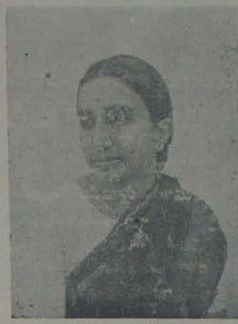
శ్రీమతి శ్రీదేవమ్మ యోధుడు లైబరల్ అనుభవించిన శేకభక్తుడు. వారిజనులకు నిరంతరం శేకకేటాన్ని గాంధీ

ఇక కాంగ్రెసు వారిజ అభ్యర్థి చిన్నయ్య స్వంత కమ్యూనిస్టు చదువుకొని, ప్రయోగాన్ని జడలి, స్వార్థంకల్ల సమరంకం అని నిలవిన