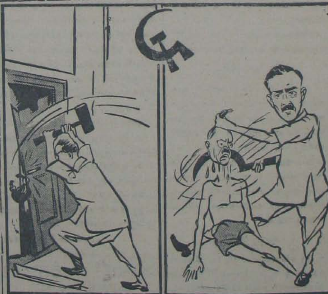
నుత్తి కొడవలి మర్మమిసరంది ఇది చక్కదెలిసి చిత్తమొచ్చినరీతి చేయండి!!

* వాదరావారు మాజీ శివ మంత్రి కిక్కిరింపొందారు కరణుకం గాదింది చరిత్రాల్లు గాకలేదని దీక్షలూని కుడివైపు వచ్చి రని వార్తలు చేయబడ్డాయి.