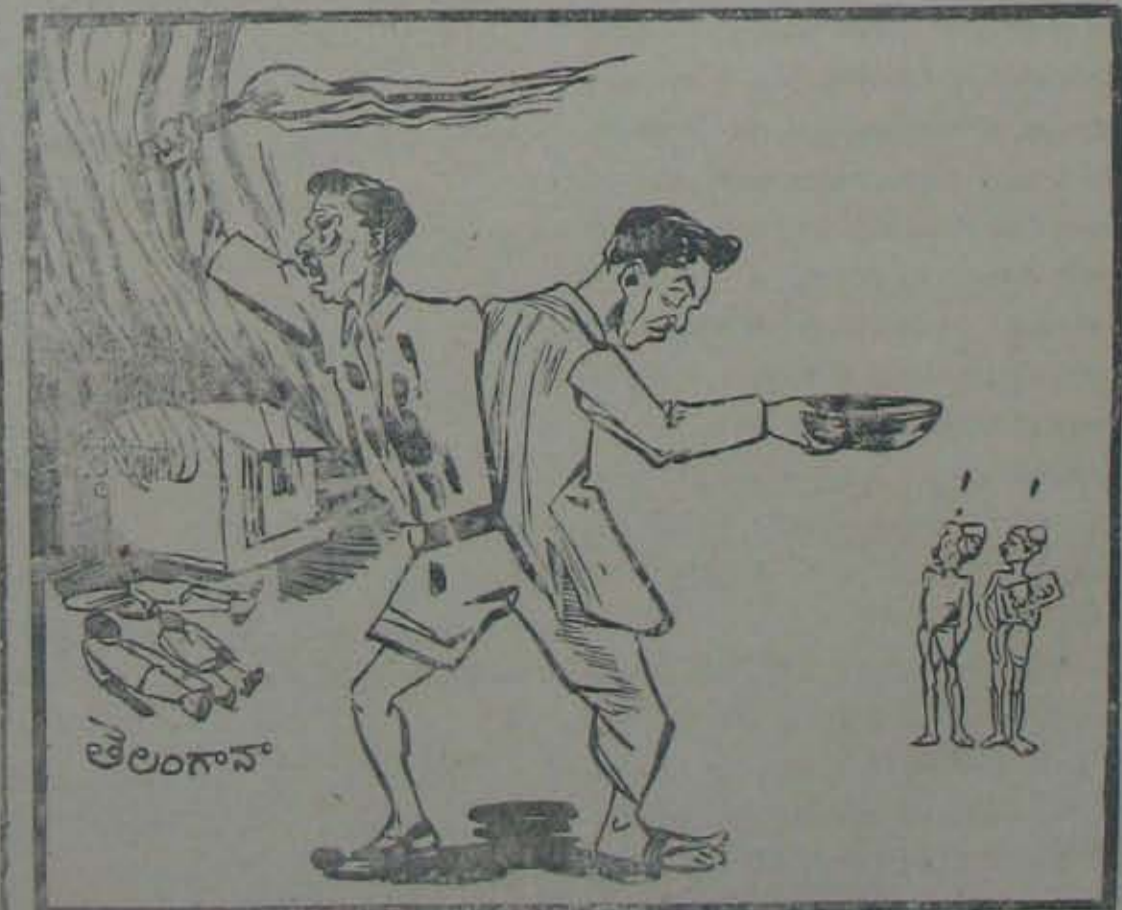
తేలంగానా పంటచేసెనై పాడుచేకారు, పట్టవగలె ప్రజల పాణాలు దీకారు, కొంపగోడ కొట్టగొట్టినారు, ఇందుకేనా కమ్యూనిస్టుకోటు?