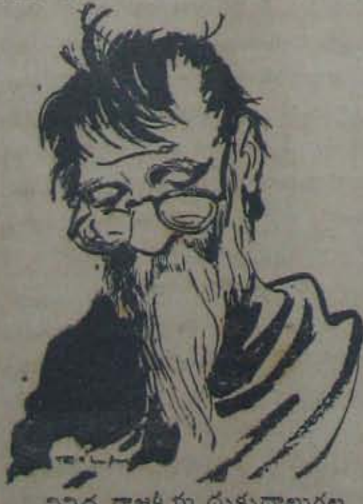
వివిధ రాజకీయ దృక్పథాల గల నాయకులను ఏకవేదిక మీద చేర్చిన భూదానోద్యమ తపస్య శ్రీ వినోబాజీ

డిప్యూటీ సీక్రటరీ ఆనంతశయనం అయ్యంగారు అందరికంటే అధికంగా విశాలాంధ్రను సమర్థించారు. కఠినమైన మాటలను గూడా వాడారు. విశాలాంధ్రను వ్యతిరేకించేవారు. యిదివరలో హైదరాబాదును మరొక పాకిస్థాన్ గా తెయారు చేయాలని ప్రయత్నించినవారేవని అందరిమీద ఆరోపించడం సబబుగాలేదు. అది ఏ విధంగానూ విశాలాంధ్ర సమస్యకు సహాయకారికాదు సరిగదా, వ్యతిరేక ఫలితాలనిస్తుంది. తెలంగాణా కొరకు ఆందోళన చేస్తున్న డాక్టరు చెన్నారెడ్డిగారలాంటి కాంగ్రెస్ వాదులందరూ రజాకార్ల దౌర్జన్యాలను ఎదుర్కొన్నవారే. హైదరాబాద్ స్వతంత్ర భారతదేశంలో ఒక భాగంగా వుండాలని కలలు గన్నవారే;