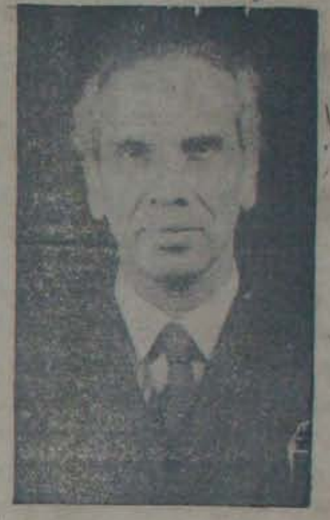
చిక్కురాజ్యసమితి పదవ సమావేశంలో ప్రముఖ పాత్ర వహించిన వ్యక్తిగా నిర్ణయించబడిన భారత ప్రతి నిధివర్గ నాయకుడు శ్రీ వి. కె. కృష్ణమీనకా

మనచైనా అతిథి ఇటీవల మనదేశానికొంతుంది అతిథులు వచ్చారు. ఈ వచ్చినవారిలో అందరికంటే ఎక్కువ అతిథ్యం పొందవలసినవారు గతవారం యిండియాకు విచ్చేసిన చైనా ప్రవారిపబ్లిక్ స్ట్రాయీసంఘ ఉపాధ్యక్షురాలు సూంగ్ చింగ్ లింగ్ ఆనుటలో ఏమాత్రం సందేహం లేదు. ఈ దాం సూంగ్ చింగ్ లింగ్, చైనా ఉత్తమోత్తమ నాయకుడు, చైనా జాతిపిత సకాయల్ సేకాగారి సరికావడమే అందుకు కారణం. సకాయల్ సేకాకుటుంబానికి భారత జాతీయోద్యమానికి అవినాభావ సంబంధముండినది. 27 సంవత్సరాలక్రితం మదాం చింగ్ లింగ్ మన దేశానికి రావలసినదిగా శ్రీ నెహ్రూ ఆహ్వానించడంలోనే, ఆమె మనకెంతి ప్రിയతమవ్యక్తి అయినది స్పష్టమవుతున్నది. కాని ఆనాటి పరిస్థితుల ప్రాబల్యం వల్ల ఆమె మనదేశానికి రాలేకపోయారు. ఇప్పుడు మనమధ్యకువచ్చి, మనచిరకాలవాంఛ నేటికేవిధంగా సాఫల్యంపొందడం ముదావహమైనవిషయం. చైనా విప్లవ ప్రభంజనంలో ఆచంచలంగా నిలచినవ్యక్తి ఆమె. మదాం సూంగ్ గారవార్షం, ఢిల్లీ ఎర్లోబులోచేసిన పౌరసన్మానసందర్భంలో ప్రధాని నెహ్రూ ప్రసంగిస్తూ “గతము పు యి ఏండ్లు గా మిమ్మల్ని గురించి వింటున్నాం. మీ మాటలను చేతలను అనుసరించాలని ప్రయత్నించాం. చైనావిప్లవం పొగినకాలంలో ఆనేకులు ఉద్ధ వించారు. చాలమంది ప్రముఖపాత్ర వహించారు. కాని ఎట్టి కుపాను వీచినపుటికీ యీ సుదీర్ఘ కాలంలో మీరుహుండాగా, ఆత్మ విశ్వాసంతో, దృఢదీక్షతో ఆచంచలంగా నిలబడ్డారు. ఆ విధంగామీరు కాంతిపుంజాలను వెదజల్లారు. ఈ కాంతి మాకు, ఇతరులకు ప్రసరించింది. మిమ్మల్ని మోచేభాగ్యం మాకు లభించింది. మా ఉద్రేకం కట్టలుతెంచుకుంటుంది.” అన్న మాటలు, మదాంసూంగ్ మన హృదయాలలో ఎట్టి వున్నతస్థానాన్ని ఆక్రమించుకొనయన్నదీ స్పష్టంచస్తాయి. ఆమెకే మా స్వాగతం. ఆమెకు దేవుడు ఆయురారోగ్యముఅనోసగి ప్రోచుగార.