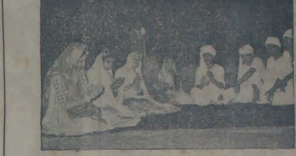
1200 మంది యూనివర్సిటీ విద్యార్థులు పాల్గొన్న యువజనోత్సవంలో కళాప్రదర్శనల పాటిలు జరిగాయి. పై చిత్రం: బృంద నాట్యంలో గౌహతి యూనివర్సిటీ టీమ్ తో ప్రదర్శన బహుమతిపొందిన దాగపూర్ విశ్వవిద్యాలయ విద్యార్థి నులు. క్రిందిచిత్రం: బృంద గానంలో యువ జన బహుమతిపొందిన లక్ష్మి యూనివర్సిటీ విద్యార్థులు.

రష్యవాయుకులను లక్షలాది ధనంవెచ్చించి పూరూరాలిప్పి - రష్యను వుదహరించిన తా మెంత గొప్పవారమో ప్రకటించుకొన పనికివస్తుందనిపాపం ఆ సభ్యురమకుంటే - రష్యను వుదహరించను. అన్ని హక్కులు తమచేగాని మీ కక్కడివని కమ్యూనిస్టువాదం.