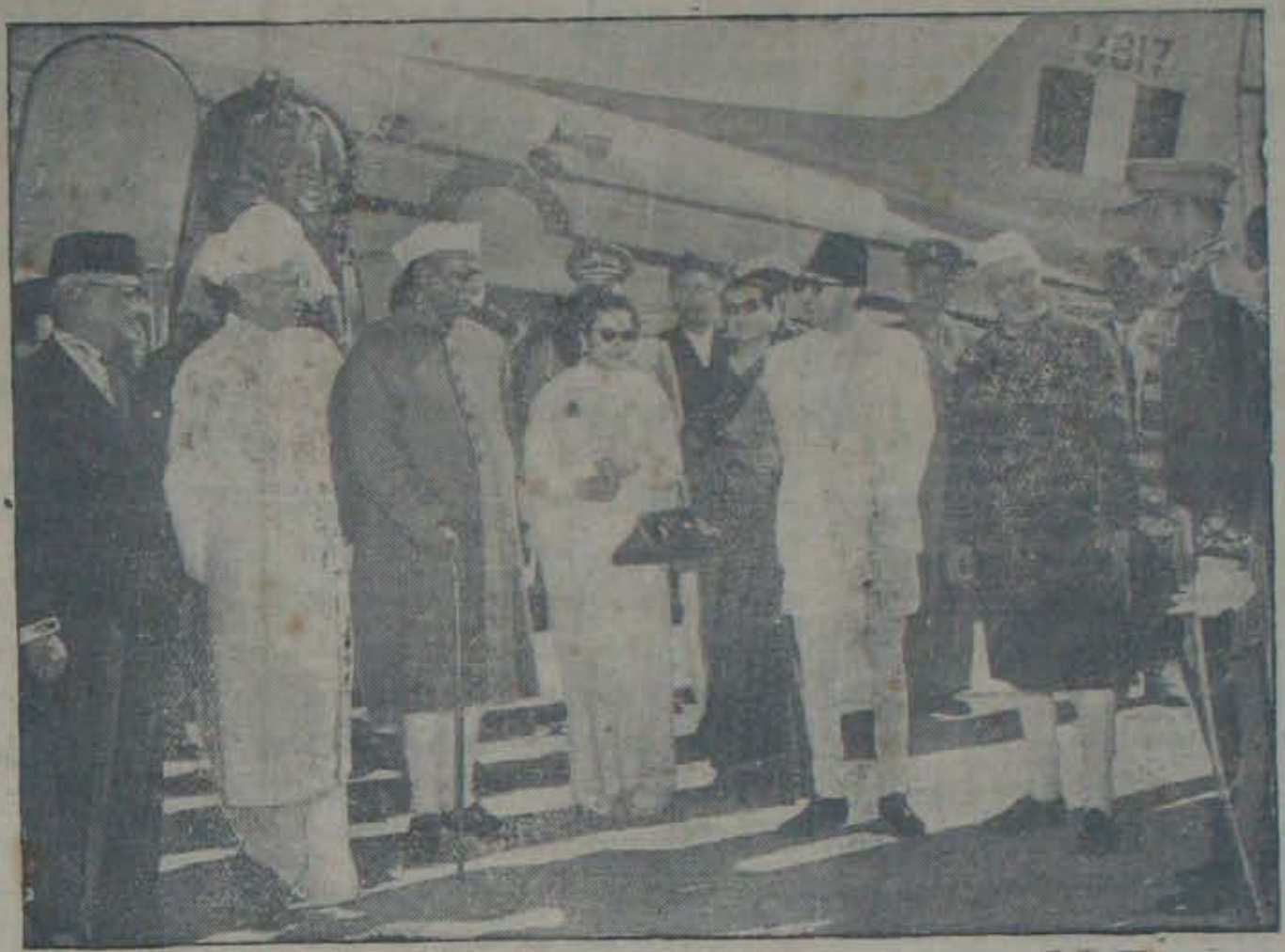
అయిదువారాలపాటు మనదేశంలో సంచరించిపోయిన నేపాల్ రాజు శ్రీ మహేంద్ర విరవిక్రమ పాదేవ, ఆయన సతీమణిగార్లతో మన నాయకులు, శ్రీ రాజేంద్రప్రసాద్, రాధాకృష్ణణ్, నెహ్రూ